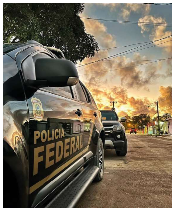
A investigação realizada pela Polícia Federal apura o envio de cocaína da fronteira do Brasil com a Bolívia para o Estado de Goiás

Na ação policial realizada na manhã desta terça-feira conta com a participação de mais de 50 policiais no cumprimento de 10 mandados de busca e apreensão nos cinco Estados.