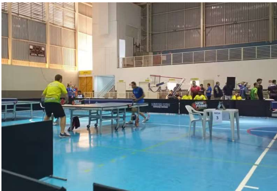
Equipe vice-campeã brasileira busca destaque no torneio continental, que acontece no Rio de Janeiro