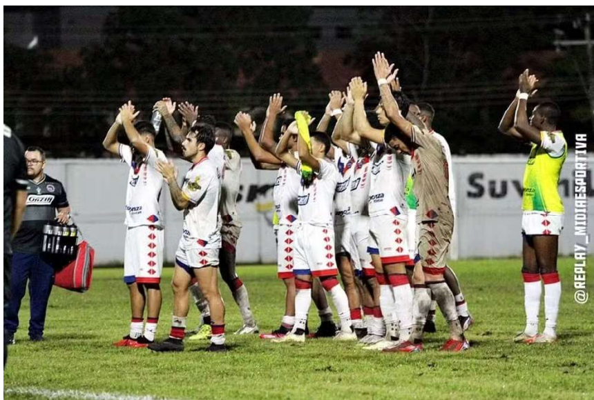
Gazin Porto Velho classificado no Campeonato Rondoniense 2025

Entre os eliminados, o Genus já não tem chances de avançar e apenas cumpre tabela con-