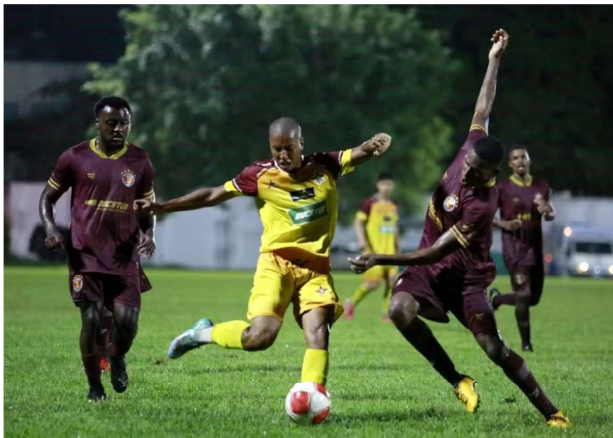
Jogadores do VEC tentam desarmar atacante do Genus

A campanha do VEC no Rondoniense 2025 refletiu os obstáculos enfrentados. Em 10 partidas, a equipe não obteve vitórias ou empates, acumulando 10 derrotas. O ataque marcou apenas 1 gol, enquanto a defesa sofreu 32,