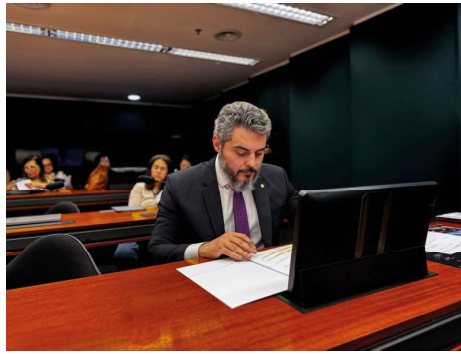
Deputado Federal Thiago Flores

A Comissão de Agricultura tem papel essencial na formulação de políticas para o setor agropecuário, abrangendo temas como crédito rural, defesa sanitária animal e vegetal, comercialização de produtos, insumos agrícolas, supervisão e eletrificação rural. Sendo Rondônia