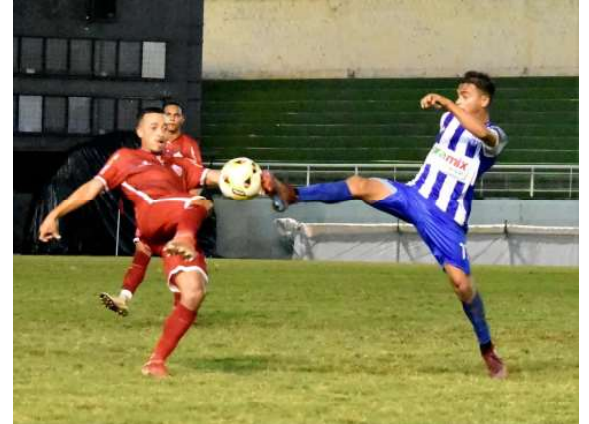
Espanhol, ex-lateral-direito do Rio Branco (AC), agora no Jipa

-AC, onde fez parte do elenco campeão estadual em 2023. Com passagens por clubes como Ipatinga, Fluminense-PI e União Barbarense,