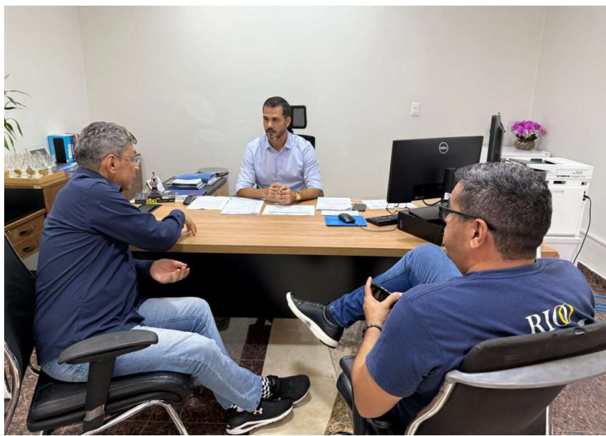
Ação contará com oferta de bolsas para cursos gratuitos aos jovens da comunidade

A Escola do Legislativo reafirma seu compromisso com a educação e qualificação profissional, garantindo oportunidades para a juventude rondoniense e fortalecendo seu papel social junto à comunidade.