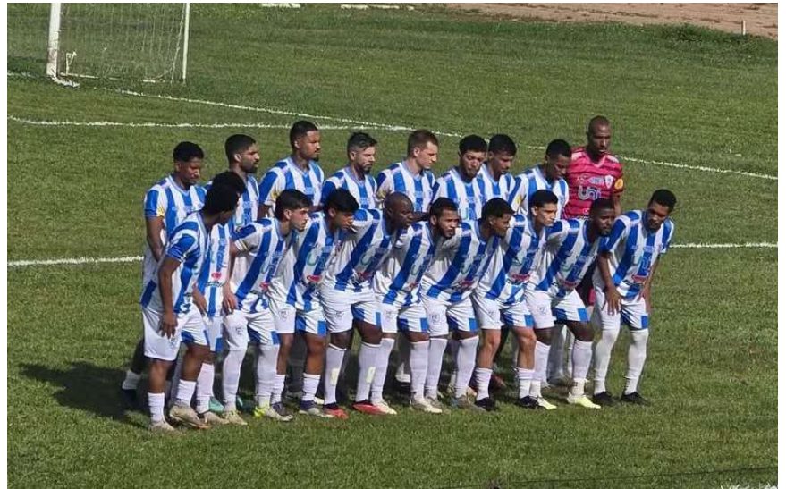
Equipe do Ji-Paraná no Aluizão

No outro jogo da rodada, Rolim de Moura e Guaporé ficaram no empate por 2 a 2 em um duelo cheio de reviravoltas. O time da casa abriu o placar com Andrey aos 24 minutos do primeiro tempo. O Rolim voltou à frente com um gol de César Júlio aos 26 minutos, mas a vantagem caiu por terra. Bacabal diminuiu para o Guaporé pouco antes do fim de jogo. Erik marcou