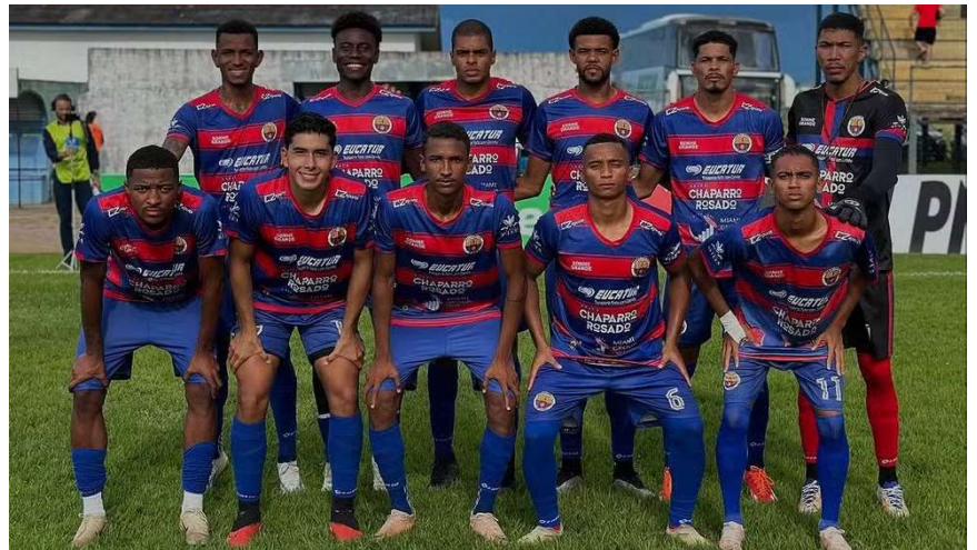
Barcelona-RO em confronto contra o VEC

na disputa da parte de cima da tabela. A equipe contou com dois gols de Tevez e um de Cirilo para bater o lanterna VEC no estádio Portal da Amazônia.