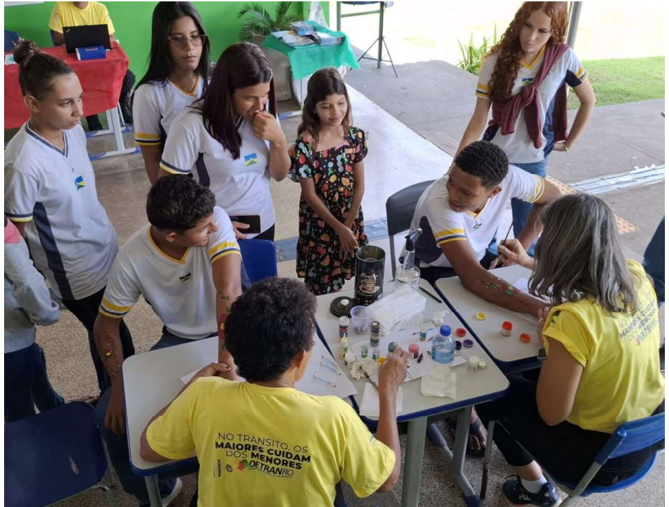
União de esforços leva ações lúdicas, educação no trânsito e serviços do Detran-RO para moradores da Zona da Mata.

O Detran-RO reforça seu compromisso com a cidadania, pois a educação no trânsito ajuda a salvar vidas. Em todas as ações, a mensagem do ano para o trânsito é enfatizada: “Desacelere, o seu bem maior