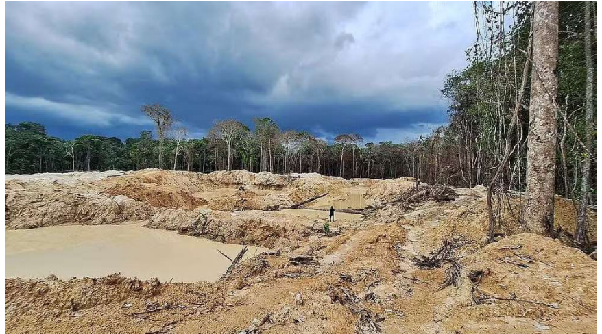
Garimpo dentro da Terra Indígena Sete de Setembro.