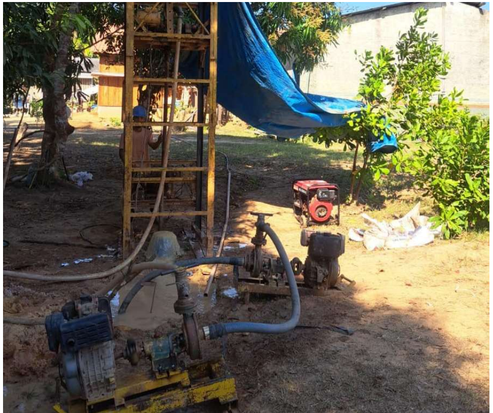
Ação visa garantir o acesso à água potável para os moradores das comunidades do baixo Madeira.

“Estamos esperando passar o período das chuvas para dar início aos trabalhos, quando, também, serão escavados novos poços artesanais e construídos os sistemas de captação, armazenamento e abas-