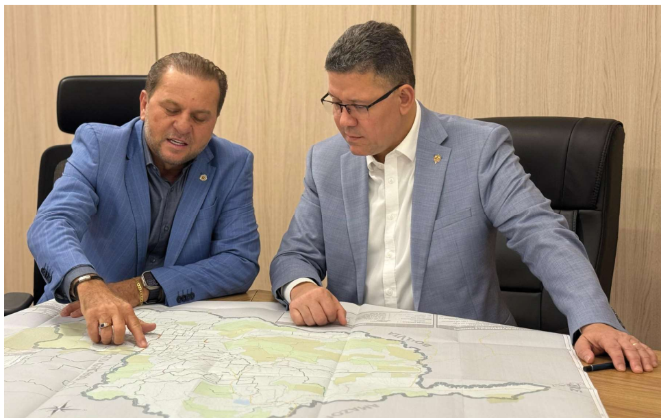
Obras de infraestrutura, educação e segurança viária estão entre as prioridades discutidas durante reunião no Palácio Governamental

De acordo com o deputado Cirone Deiró, o governador Coronel Marcos Rocha já realizou importantes investimentos em obras de infraestrutura, especialmente na construção de pontes de concreto e aço. Ele destacou a construção da ponte sobre o Rio Ribeirão, no distrito de Pacarana, que recebeu um investimento do governo do estado de R$ 7,2 milhões e atendeu a uma reivindicação de mais de 30 anos dos moradores da região. Outro exemplo citado pelo deputado foi a construção da ponte de concreto armado e aço sobre o Rio Ararinha, na RO-495, que dá acesso à cidade de Parecis e que também contou com um investimento superior a R$ 2,7 milhões do governo do estado. “São obras que estão contribuindo para o desenvolvimento do nosso estado,” reconheceu.