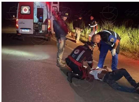
Acidente ocorreu na entrada do ramal Jatuarana, em Porto Velho.

Conforme informações obtidas pela reportagem, o motociclista atingiu o ciclista no momento em que ele tentava atravessar a via. Com o impacto, ambos caíram ao solo e