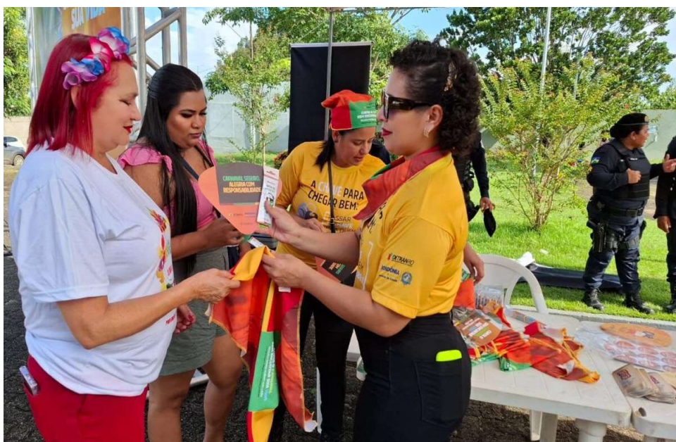
Ações de educação foram intensificadas pelo Detran-RO durante as festividades de Carnaval.