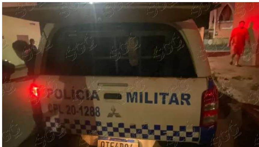
Estuprador, segundo a vítima, estava em uma moto. Polícia fez buscas, mas não encontrou. Investigação segue

Logo depois a levou para um prédio comercial abandonado, tirou as roupas e a estuprou. Ainda segundo a vítima, o homem não usou preservativo e fugiu após o abuso. A PM foi acionada, fez diligências, mas ninguém foi preso ou identificado.