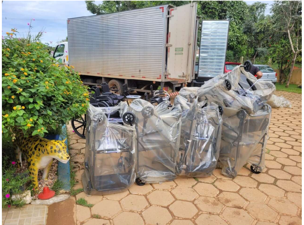
Foram entregues 40 equipamentos de mobilidade ao Lar do Idoso Maria Tereza da Lamarta, em Vilhena.

Para o governador de Rondônia, Marcos Rocha, a entrega dos equipamentos intensifica o empenho da gestão estadual com a dignidade e o bem-estar dos idosos, garantindo assim, mais acessibilidade e qualidade de vida. “O governo segue investindo e trabalhando para atender quem mais precisa, promovendo inclusão e respeito”, salientou.