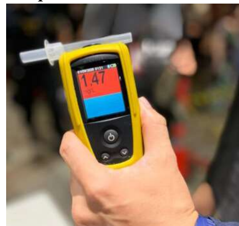
Registro de crime de trânsito em teste do etilômetro.

A margem de erro do etilômetro, aparelho que faz a medição de álcool por litro de ar expelido, é de até 0,04 miligramas. Quando o resultado do teste é de 0,05 até 0,33 miligramas, o condutor deve responder processo administrativo de suspensão do direito de dirigir, conforme o Artigo 165 do CTB. É caracterizado crime de trânsito, condutores cujo teste registre a partir de 0,34 miligramas de álcool por litro de ar alveolar expelido, conforme previsto no Artigo 306 do CTB, concomitante, o condutor é preso em flagrante e conduzido à Central de Polícia.