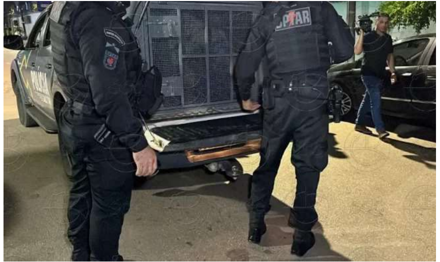
Dupla foi presa na esquina da Avenida Guaporé com Raimundo Cantuária, no Agenor de Carvalho

Diante da situação, os dois foram encaminhados ao complexo penitenciário, onde permanecerão à disposição da Justiça.