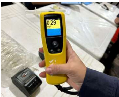
Teste com resultado para processo administrativo de suspensão do direito de dirigir.

É importante que motoristas e motociclistas saibam que nenhuma quantidade de álcool é tolerável à frente da condução de um veículo, mas há diferenças quanto às penalidades aplicadas, conforme resultado do teste de etilômetro.