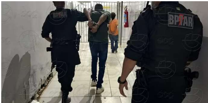
Homem afirmou ser integrante de facção criminosa e responsável por execuções.

formações obtidas pela reportagem, policiais receberam a denúncia de que o criminoso estava como passageiro de uma moto por aplicativo e pretendia cometer roubos. Durante a abordagem, ele afirmou ser integrante do Primeiro Comando da Capital (PCC) e declarou ser um dos responsáveis por execuções de rivais do Comando Vermelho (CV).