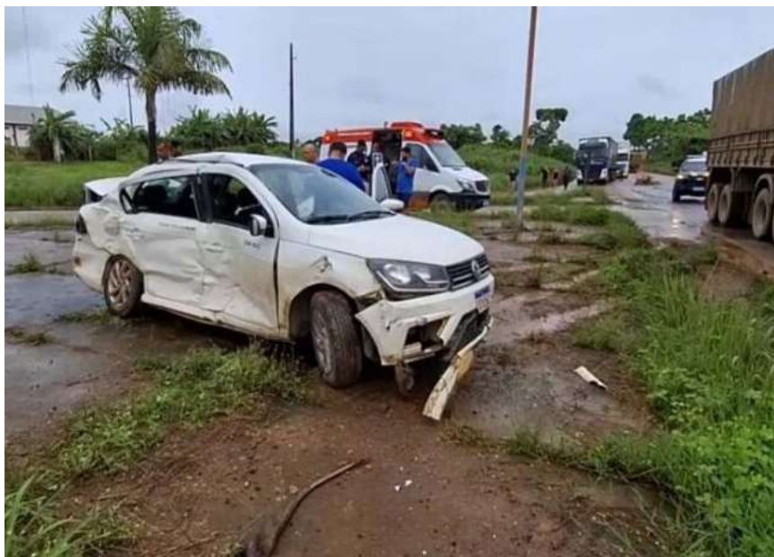
Cinco pessoas ocupavam o táxi. Quatro foram socorridas em estado grave e uma mulher morreu

A Polícia Rodoviária Federal (PRF), foi acionada para controlar o trânsito e, o corpo de bombeiros também prestou apoio. Até a publicação dessa matéria não foi possível identificar a origem ou o destino do táxi.