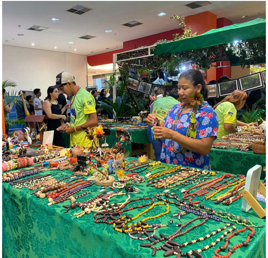
Os selecionados contarão com o suporte do governo de Rondônia, que irá fornecer as passagens

Os interessados devem entregar todos os documentos exigidos no edital em um envelope lacrado, na Sejucel, localizada no Edifício Rio Cautário, na Avenida Farquar, nº 2.986, 5º Andar, Bairro Pedrinhas, em Porto Velho. O atendimento é de