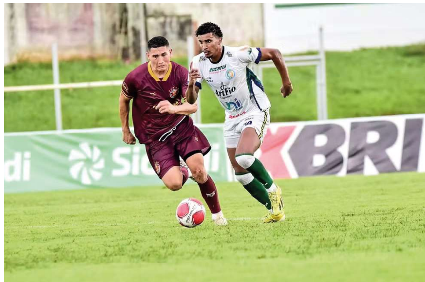
Rolim de Moura e VEC atuando no estádio Cassolão