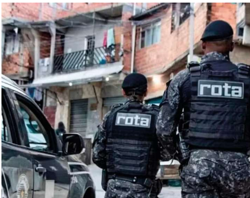
Policiais da Rota deram apoio à ação da polícia de Rondônia

Um suspeito de liderar a facção criminosa Primeiro Comando da Capital (PCC) em Rondônia foi alvo de uma operação de combate ao crime organizado nesta segunda-feira (3), em São Paulo. Segundo o Ministério Público de Rondônia (MP-RO), o líder dava ordens para a facção criminosa agir em Rondônia, mesmo estando em outro estado.