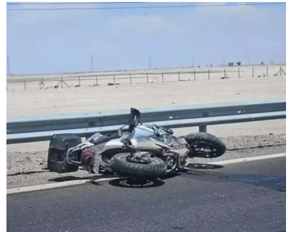
Advogado teria perdido o controle da moto e colidiu com a mureta

Durante a viagem, os motociclistas seguiam por uma rodovia rumo à Argentina quando o advogado colidiu com a mureta de uma rotatória, após passar por um via-