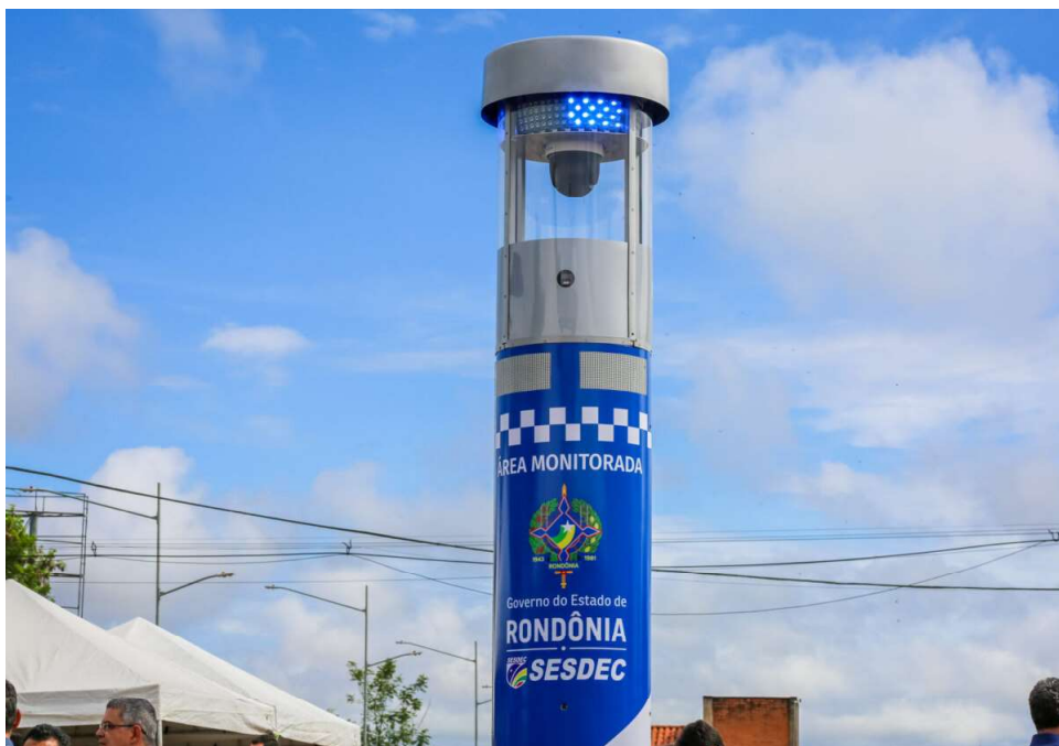
Pedido do parlamentar foi apresentado à Sesdec nesta semana.

Nos últimos anos, Rondônia tem registrado redução expressiva nos índices de criminalidade, com quedas significativas nos casos de roubos e furtos entre 2022 e 2024. Em Porto Velho, por exemplo, os roubos reduziram 37% e os furtos 28% em relação a 2022, de acordo com dados da Secretaria