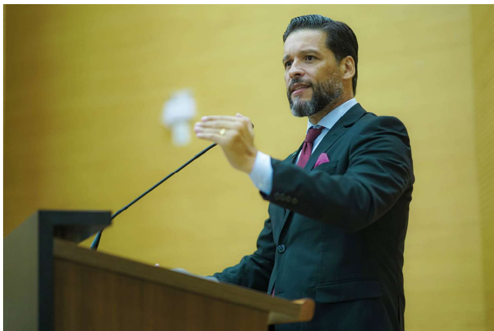
A demanda tem como objetivo melhorar as condições de trafegabilidade e segurança da via

A solicitação reforça o compromisso do parlamentar em atender às necessidades das comunidades locais, buscando soluções que impactem diretamente a qualidade de vida da população. A expectativa é que as melhorias sejam executadas em breve, proporcionando maior segurança e fluidez no tráfego da região.