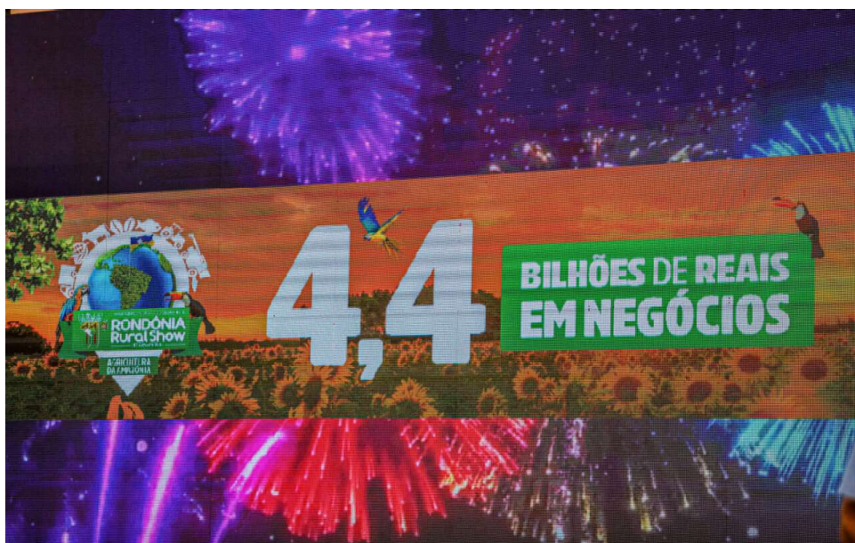
A Rondônia Rural Show Internacional alcançou R$ 4,4 bilhões em negócios na sua última edição e tem se consolidado como um dos maiores eventos agropecuários da Região Norte

Com a realização da feira, a Secretaria de Estado da Agricultura (Seagri) contribui para o desenvolvimento do agronegócio e de mais de 600 expositores, promovendo a integração de pequenas e grandes empresas, além de criar novas oportunidades de