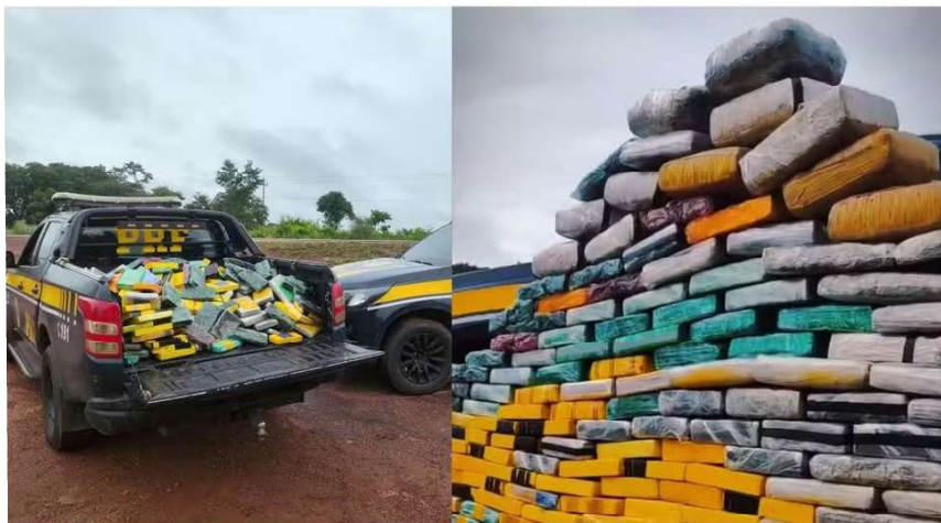
Droga apreendida pela a PRF em Guajará-Mirim (RO)

Cerca de 340 kg de drogas foram apreendidos, entre maconha e cocaína. O motorista afirmou aos policiais que teria recebido R$ 5 mil para levar a droga de Guajará-Mirim até Nova Mamoré (RO).