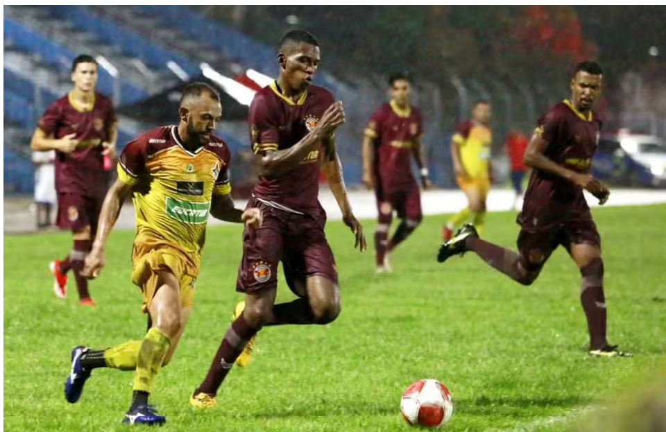
Genus goleou o Vilhena por 5 a 0 no Aluizão

Na próxima rodada, o Genus se prepara para mais um desafio contra o Gazin Porto Velho, sábado às 16h, Rolim de Moura recebe o Barcelona, domingo às 17h30 e o Vilhena tentará reagir para conquistar seus primeiros pontos contra o Ji-Paraná, domingo às 16h.