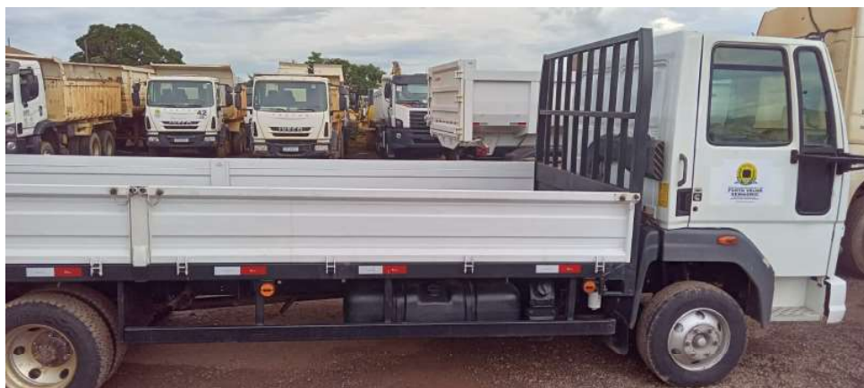
Caminhão que estava inoperante há três anos, agora soma ao serviço de auxílio aos produtores rurais