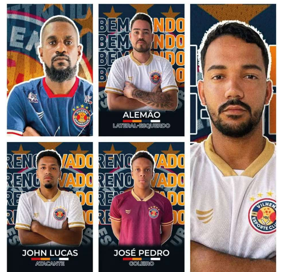
Time estreia neste sábado, 01, contra o Rolim de Moura, fora de casa