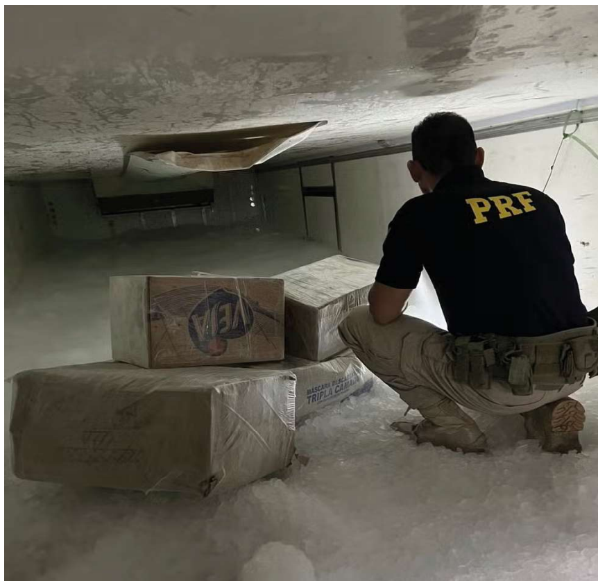
foram apreendidos 176 quilos de entorpecentes

O condutor, o veículo e as drogas apreendidas foram encaminhadas à Delegacia da Polícia Civil em Ji-Paraná (RO) e ficarão à disposição da Justiça.