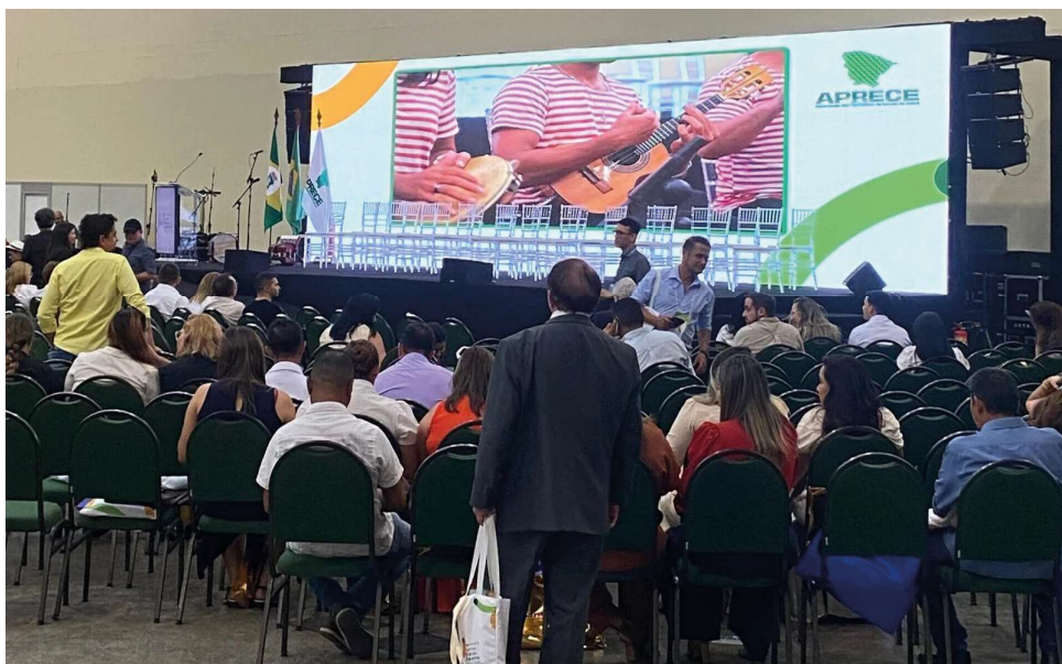
Evento aconteceu entre nos dias 28 e 29 de janeiro, em Fortaleza

Durante o evento, o vice-presidente da AROM destacou a importância de iniciativas como esta para fortalecer as gestões municipais de Rondônia. “É