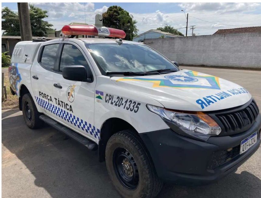
Casal foi entregue à Polícia Civil.

Segundo a polícia, a suspeita carregava uma bolsa azul com identidades falsas, comprovantes de PIX e cartões de capitalização. De acordo com o boletim de ocorrência, o Serviço de Inteligência da Polícia Militar já monitorava os suspeitos e solicitou a abordagem no mo-