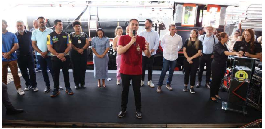
prefeito Léo Moraes abriu as festividades

Além de reviver a história com a litorina, os participantes também puderam apreciar uma exposição de carros antigos. Os veículos são de vários modelos e anos. Outro destaque da programação foi a apresentação do show “A fina Flor do Samba”, com o poeta da cidade, Ernesto Melo. O artista de Porto Velho fez uma belíssima apresentação com músicas de autorias próprias e que falam sobre a cidade. Além disso, o show