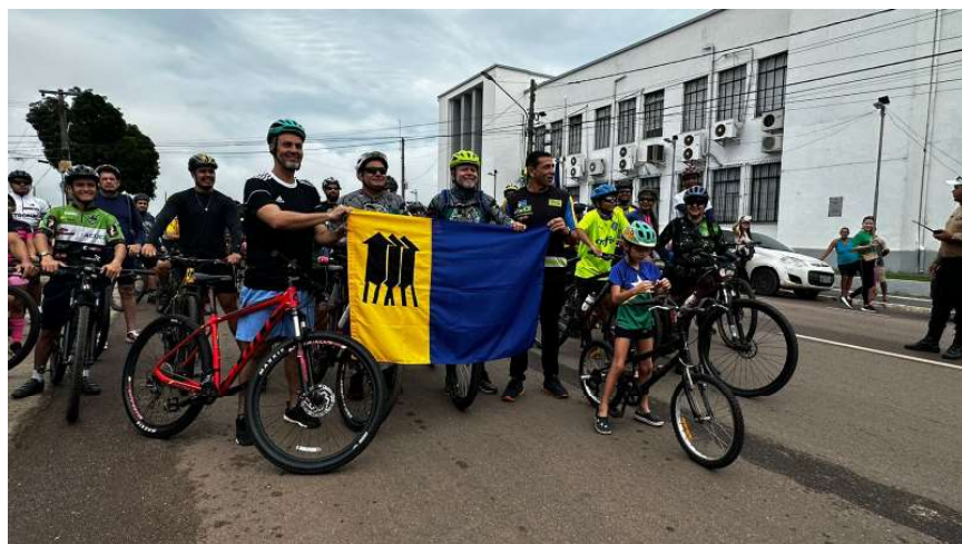
Evento reuniu ciclistas pelas ruas da capital em busca de lazer, história e, principalmente, saúde.

Além de comemorar o aniversário de instalação de Porto Velho pelos pontos turísticos, o Bike Tour teve como objetivo incentivar o uso