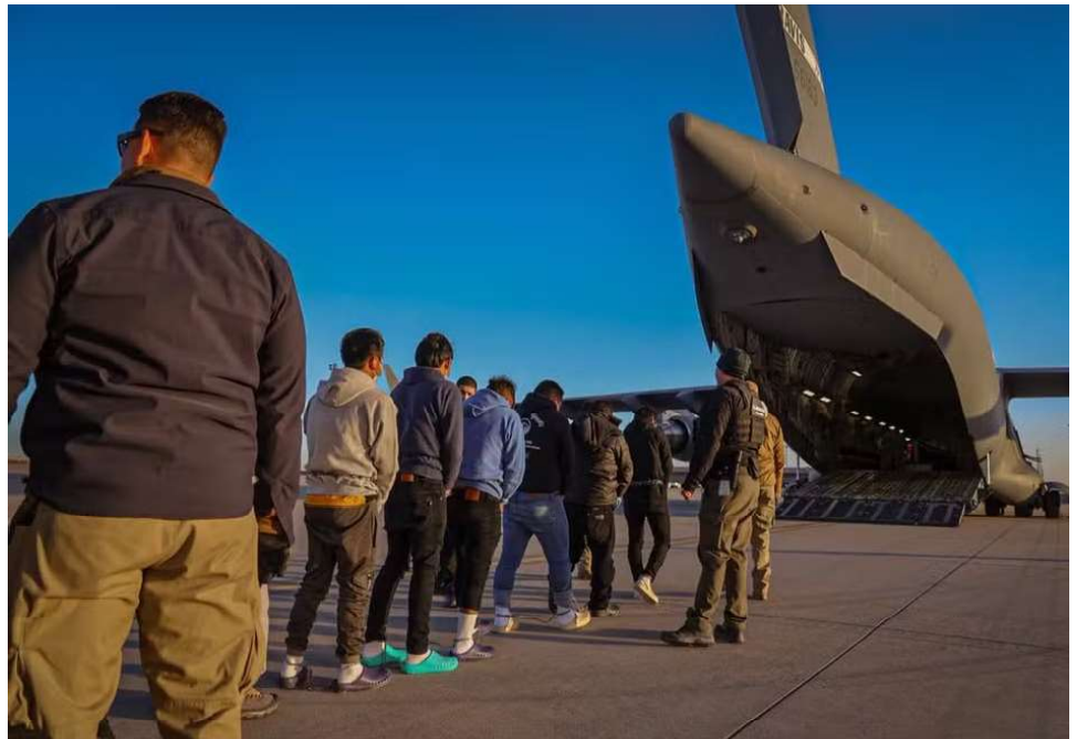
Avião pousou em Manaus (AM) na sexta-feira (24), e imigrantes desembarcaram algemados e com os pés acorrentados. 538 passageiros, de diferentes origens, já foram presos desde a posse de Trump.

A reportagem entrou em contato com a FAB para entender quando e como o passageiros rondonienses serão transportados, mas não obteve retorno até a atualização mais recente desta reportagem. Ao tomar posse para um novo mandato na última segunda-feira (20), o presidente america-