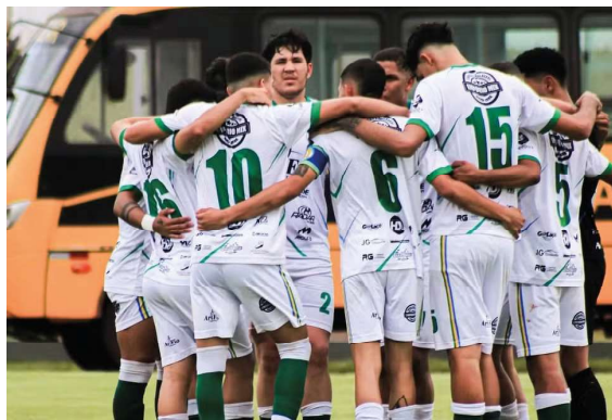
Equipe do Rolim de Moura reunida antes da decisão contra o Ji-Paraná

Com as semifinais definidas, Rolim de Moura e Pimentense seguem na disputa pelo título da Copa Rondônia e pela vaga na final contra o Gazin Porto Velho. Assim como nos duelos deste domingo, o Porto Velho também garantiu sua classificação em uma dramática disputa de pênaltis,