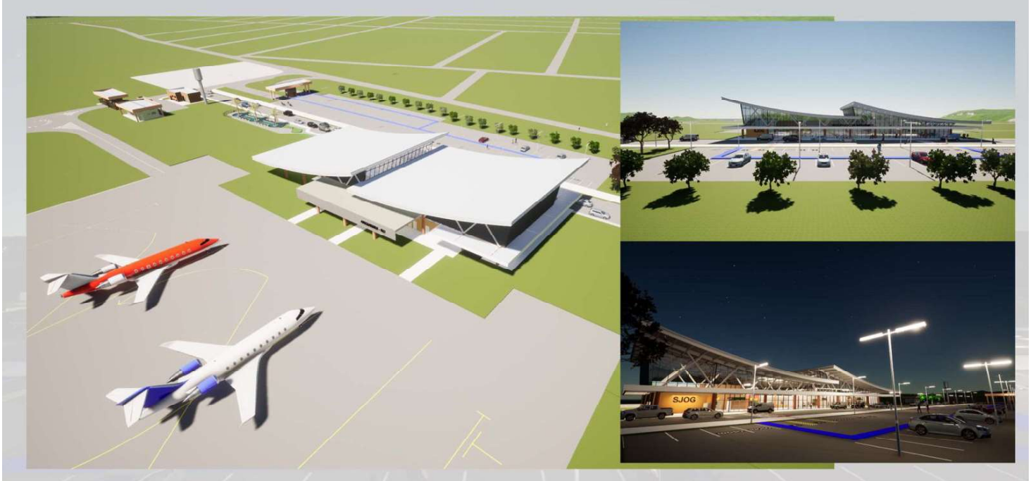
Aeroporto de Ariquemes terá 1.573 metros de área construída e pista de 1.306 metros

A Empresa Brasileira de Infraestrutura Aeroportuária (Infraero) que assumiu no ano passado a administração, operação e exploração do terminal do aeroporto de Ariquemes (RO) divulgou imagens e vídeo de como ficará a nova estrutura com obra de estruturação e construção de um