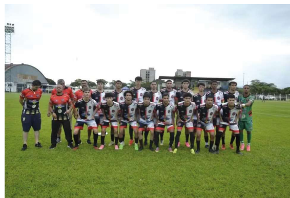
Equipe do Pimentense bate VEC fora de casa

em Vilhena, o Pimentense enfrentou o Vilhena Esporte Clube e perdeu por 3 a 2 no tempo regulamentar. No entanto, a vitória por 2 a 1 no jogo de ida levou a disputa para os pênaltis. Mais uma vez, a equipe de Pimenta Bueno mos-