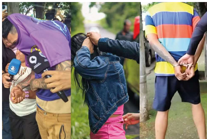
Suspeitos presos na sexta-feira (17)

O Ministério da Justiça e Segurança Pública (MJSP) enviou ajuda da Força Nacional para combater o crime organizado em Porto Velho, cerca de 60 agentes já estão atuando em Porto Velho e o