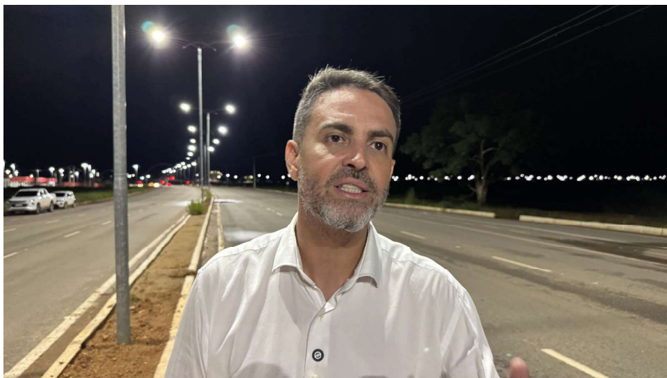
Prefeito Léo Moraes fala sobre a meta de iluminar 100% da cidade.

Na Santos Dumont, os porto-velhenses têm à disposição uma ciclovia e uma faixa para fazer caminhadas. A via é um corredor de mobilidade e facilita o fluxo de veículos na zona Norte, região que possui diversos condomínios re-