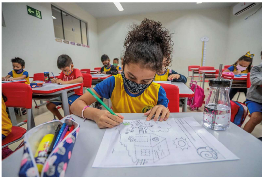
Todas as escolas, urbanas e rurais, estarão prontas para receber os alunos no dia 10 de fevereiro

Os diretores, equipe pedagógica, professores e de-