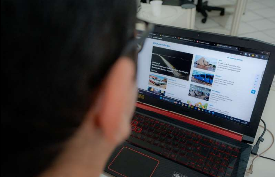
A medida busca alinhar Porto Velho às melhores práticas de inclusão, promovendo um ambiente de trabalho mais acolhedor e acessível

A Prefeitura de Porto Velho sancionou, na última segunda-feira (13), a Lei nº 3.243/2025, que torna obrigatória a realização de adaptações razoáveis no ambiente de trabalho para pessoas com deficiência, Transtorno do Espectro Autista (TEA) ou outros transtornos do neurodesenvolvimento. A iniciativa, assinada pelo prefeito Léo Moraes visa promover a inclusão e a igualdade de