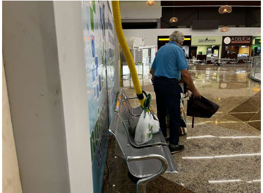
Paralisação da obra vai permitir o reinício para finalizar as partes faltantes em relação ao que foi contratado.

reinício para finalizar as partes faltantes em relação ao que foi contratado. “Esse é o instrumento para fazer com que o contrato não vença e não tenhamos, eventualmente, que contratar outra empresa para finalizar e entregar a rodoviária para funcionamento”, disse.