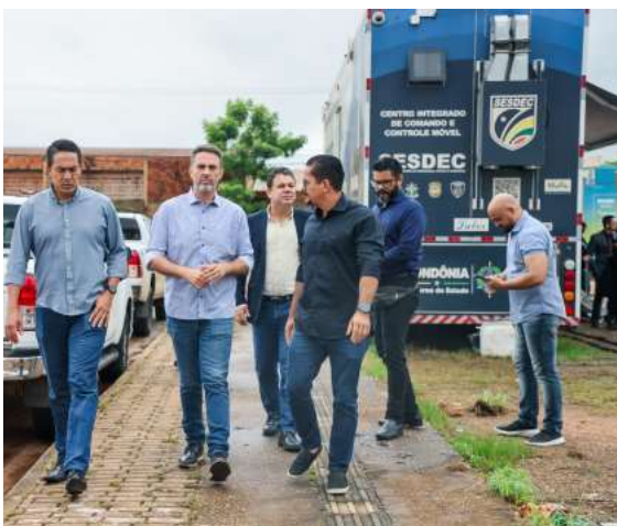
Prefeitura da capital deve apresentar em breve o decreto para iniciar o trabalho do agente de ordem pública

O subcomandante da PM informou que mais de 40 apartamentos no Morar Melhor foram lacrados, pois uns eram utilizados como esconderijos e outros usados para alugar, por parte do grupo criminoso.