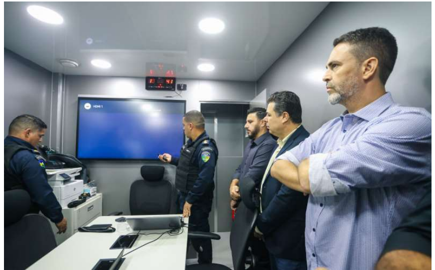
O prefeito se reuniu com as demais autoridades, na unidade móvel instalada pela Sesdec no Morar Melhor

rência da sede do 9º BPM para o Morar Melhor, o prefeito reforçou que é preciso vir acompanhado de outros equipamentos públicos, envolvendo atendimento de saúde e escolar, além de lazer e esportes. “A Prefeitura discute a posse e titulação ao Estado da área para o Batalhão, desde que haja essa possibilidade de inclusão de atendimento à saúde e educação, modelo que queremos implantar no Morar Melhor e nos demais conjuntos habitacionais”, completou.