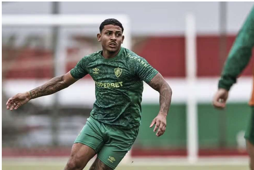
Gabriel Pires acerta com clube grego e John Kennedy está apalavrado com Pachuca

Em fim de contrato, Diogo Barbosa recebeu uma