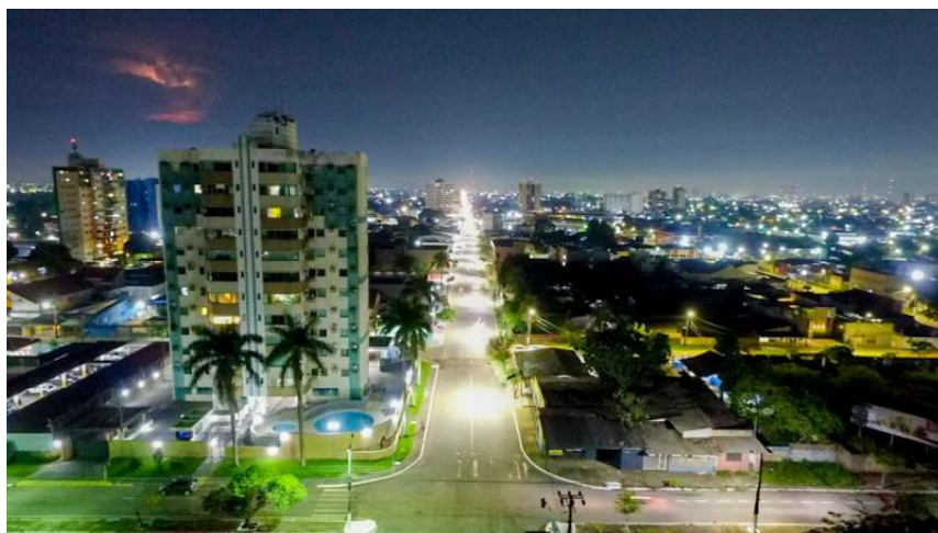
Os avanços na iluminação seguem distritos, comunidades e vilas rurais de Porto Velho.

Responsáveis pelos avanços na iluminação pública do município de Porto Velho, os Programas Proled e Proluz implantados pela atual gestão, por meio da Emdur, revolucionaram o visual da cidade, padronizando e melhorando a qualidade da iluminação. Segundo Gustavo Beltrame, presidente da Emdur, “o Programa Proled, de eficiência energética implantado em 2021, modernizou toda a infraestrutura de iluminação pública de Porto Velho. Foi desenvolvido para substituir as arcaicas ilumina-