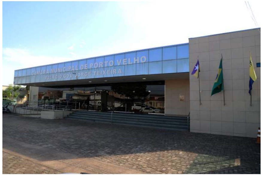
Reajuste valerá para os próximos mandatários