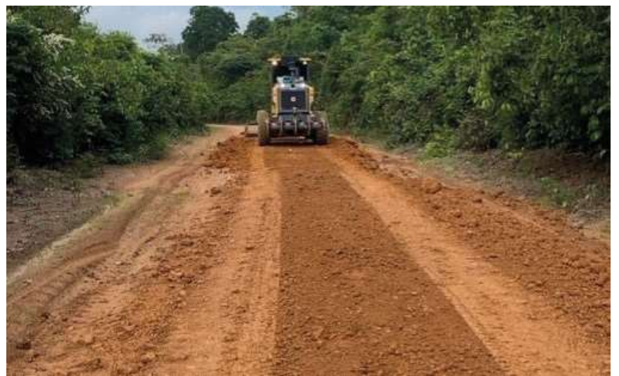
A Prefeitura tem investido na melhoria da infraestrutura viária para garantir o escoamento da produção

Com o suporte contínuo da Semagric, os agricultores têm a oportunidade de expandir suas atividades, melhorar suas práticas e contribuir de maneira significativa para a economia local”.