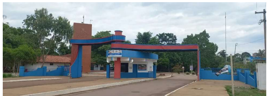
Campus da Unir em Porto Velho

A ação civil revela que, antes da bonificação, 70% dos alunos de Medicina da UNIR eram de outros estados. Em 2024, quando o bônus estadual foi utilizado na seleção, houve um aumen-