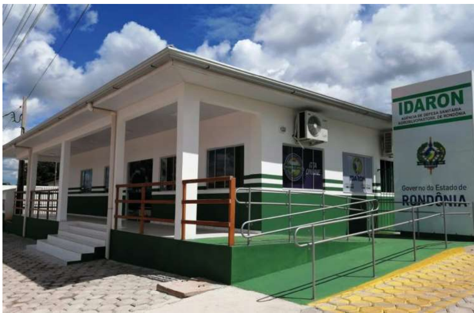
Projeto beneficia servidores da Idaron

danças aprovadas não afetam a estrutura remuneratória atual e estão alinhadas ao Plano Plurianual 2024-2027. A medida foi construída em diálogo com sindicatos dos servidores e leva em consideração o cenário de contingenciamento orçamentário im-