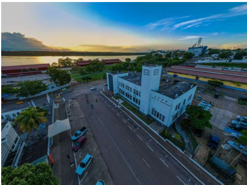
Das manifestações recebidas, de janeiro até o momento (dezembro), 640 foram consolidadas

Das manifestações recebidas, de janeiro até o momento (dezembro), 640 foram consolidadas, uma média de cerca de 100 manifestações mensais. As solicitações representam a maior parte dos registros deste ano, somando 425, enquanto as reclamações somaram 315, 44 denúncias, sendo 18 manifestações de sugestões e ainda quatro de elogios. De acordo com a Ouvidoria, as manifestações registradas abrangem diversos temas, predominando