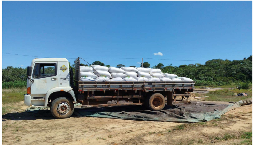
Entre os programas, destaca-se o Programa de Transporte da Produção da Agricultura Familiar

Para complementar o suporte aos pequenos produtores, a Prefeitura tem investido na melhoria da infraestrutura viária para garantir que o escoamento da produção agrícola ocorra de forma eficiente e sem transtornos. Com estradas bem conservadas e acessíveis, os agricultores podem transportar seus produtos com maior facilidade,