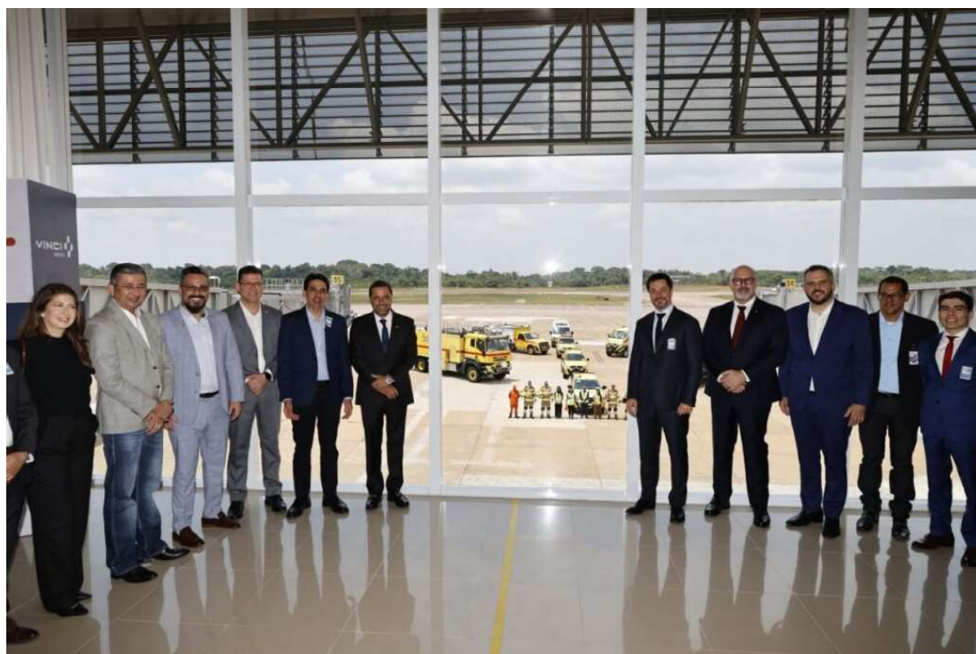
Durante a cerimônia, o Ministro de Portos e Aeroportos do Brasil, Silvio Costa Filho, reforçou a colaboração com a VINCI Airports para o crescimento da infraestrutura na Região Norte

Para marcar a entrega oficial dessas intervenções, ocorreu uma cerimônia no Aeroporto de Porto Velho, com a presença do Diretor Regional da VINCI Airports para Portugal, Brasil e Cabo Verde, Thierry Ligonnière, o Diretor-presidente da VINCI Airports no Brasil, Julio Ribas, o Ministro de Portos e Aeroportos, Silvio Costa Filho, o Secretário Nacional de Aviação, Thomé França, e outras autoridades federais e locais. Este grande plano de obras fez parte do compromisso da VINCI Airports ao adquirir em 2021 o grupo de aeroportos da Amazônia. Com um investimento total de R$ 1,4 bilhão, as obras contemplaram os aeroportos de Manaus (AM), Tefé (AM), Tabatinga (AM), Porto Velho (RO), Boa Vista (RR), Rio Branco (AC) e Cruzeiro do Sul (AC), com o objetivo de melhorar a segurança, acessibilidade, conforto e eficiência