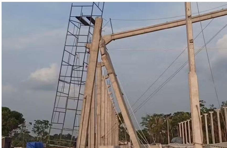
Viga de concreto desabou em obra que está sendo realizada em Presidente Médici (RO)

o caso, incluindo a dinâmica do desabamento e possíveis responsabilidades.