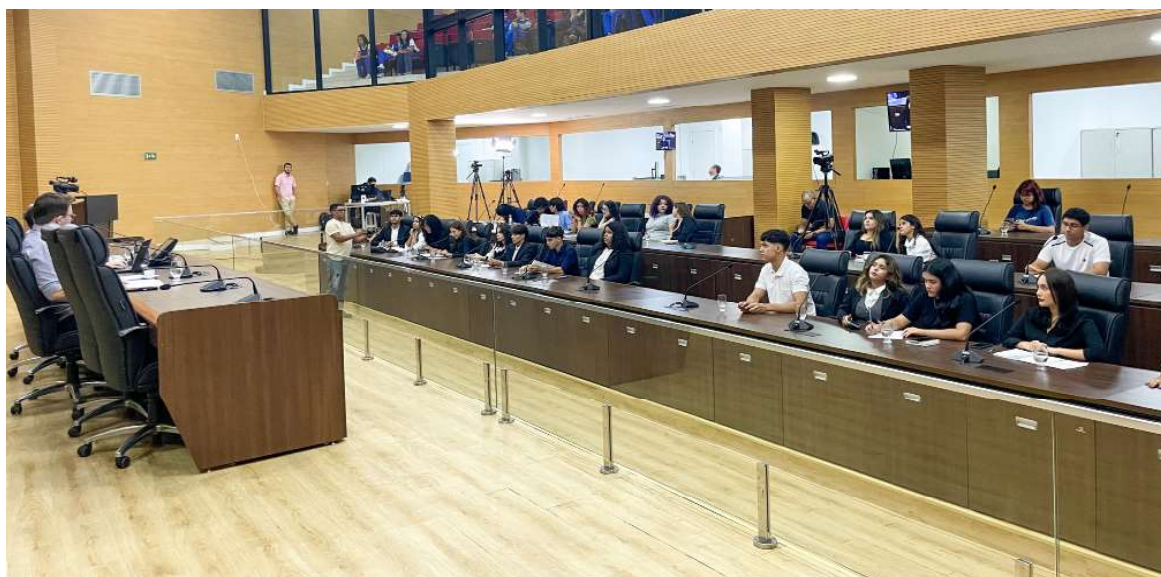
Alunos foram selecionados por adesão voluntária

estudante do 2º ano do ensino médio, considera o debate muito bom, principalmente para a geração de estudantes. “Debates em que a gente aborda temas políticos, como sistemas socioeconômicos, sistemas políticos, é muito bom, principalmente para a minha geração, que está nessa transição da adolescência para a vida adulta, da gente começar a ter aquele forte entendimento sobre política, sobre os sistemas, como funciona, principalmente a questão econômica, porque a gente vê que na nossa geração não tem essa devida valorização da política, da gente estudar a política e entender como ela funciona”, afirma a