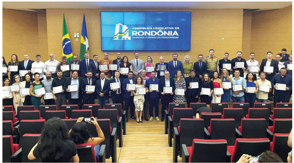
Instrutores da Acadepol recebem votos de louvor por curso de formação