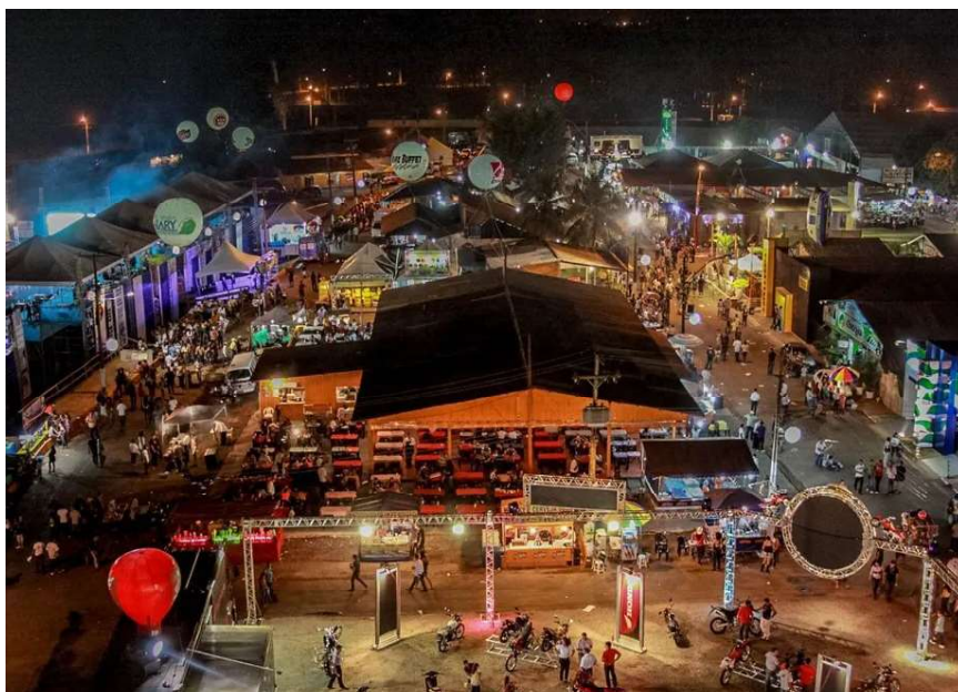
Expovel é realizada em Porto Velho

Em nota, o governo de Rondônia informou que vai colaborar ativamente com todas as fases e desdobramentos da operação e que “não compactua com atos de corrupção em nenhuma de suas esferas e mantém vigilância constante sobre a correta utilização dos recursos públicos”.