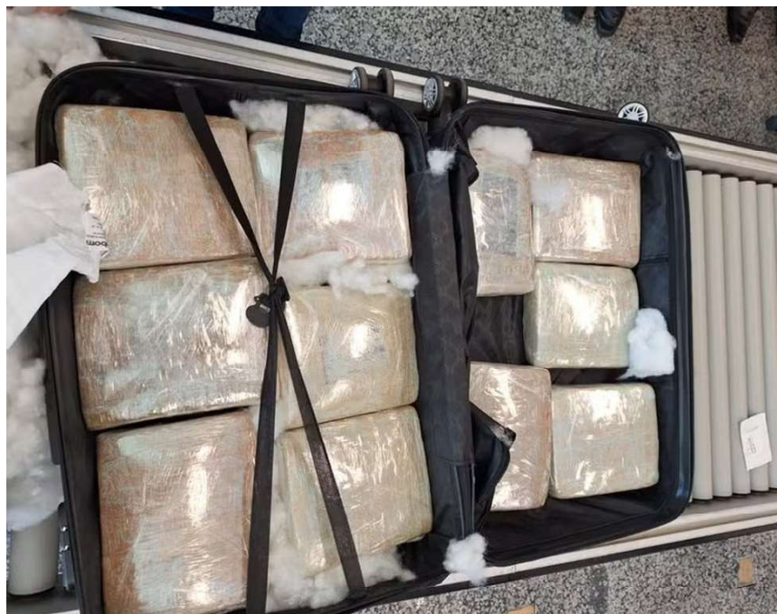
Entorpecentes estavam em duas malas

pela equipe da PF. Durante o interrogatório, ela admitiu estar praticando tráfico interestadual de drogas. Na mala continha mais de 11 kg de maconha em forma de tabletes. Depois do procedimento legal, a passageira foi submetida a exame de corpo de delito e em seguida, foi encaminhada à cadeia Pública de Porto Velho, onde ficará à disposição da Justiça para o prosseguimento das investigações