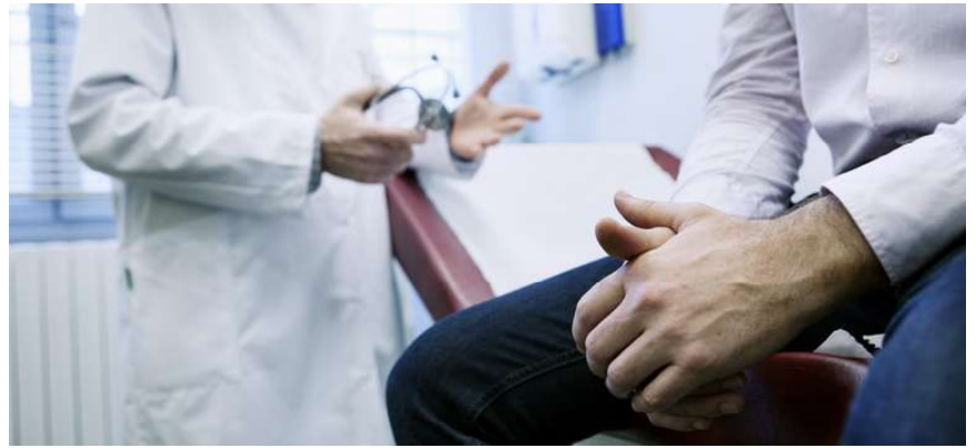
Projeto tem por objetivo promover a saúde da população masculina e reduzir a mortalidade por essa doença

Dessa forma, a proposição tem por objetivo promover a saúde da população masculina e reduzir a mortalidade por essa doença. Entre as diretrizes da política, está o incentivo à pesquisa e à inovação tecnológica voltadas para a prevenção e o trata-