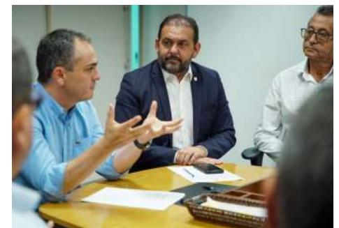
Gonçalves explica aos prefeitos o momento que vive o governo.

pois é uma lei que passa a adotar um critério de exigência de acordo com o tamanho do negócio e vamos dar toda segurança jurídica para destravar junto às Câmaras Municipais, garantindo um impacto positivo na economia local”, frisou. Além disso, foi anunciado um Fórum de Desenvolvimento Econômico programado para o próximo ano, voltado para prefeitos, vice-prefeitos e secretários com papel crucial no desenvolvimento econômico.