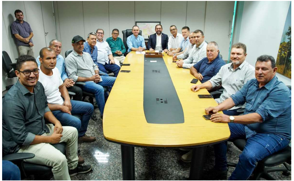
Prefeitos e vice-prefeitos foram recebidos pelo vice-governador Sérgio Gonçalves, sob orientação do deputado Laerte Gomes

O deputado Laerte Gomes destacou a importância da parceria entre o governo estadual e as prefeituras. “Temos um governo municipalista e vamos manter essa colaboração, fortalecendo os municípios. Juntamente com o vice-governador e secretário da Sedec, Sérgio Gonçal-