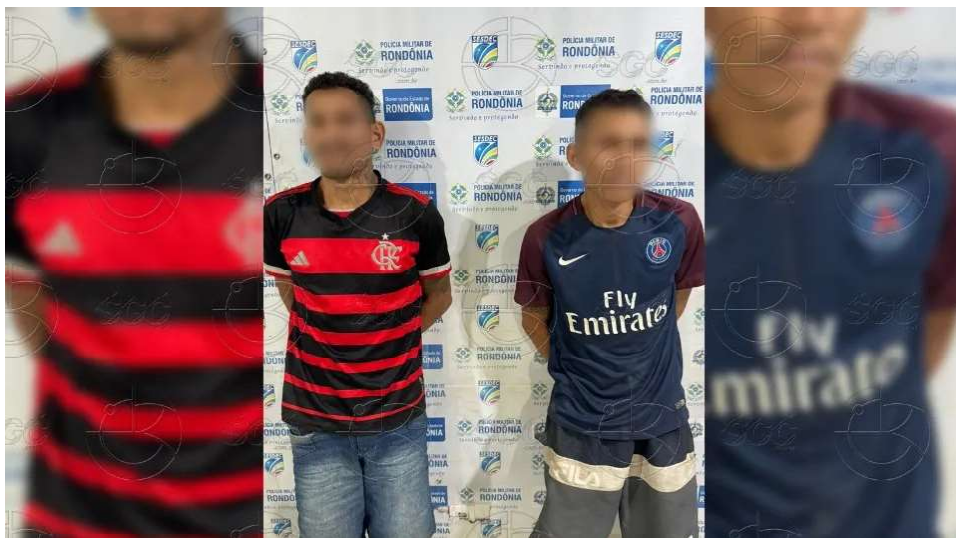
Homens tentam fugir, mas são interceptados por equipe policial durante patrulhamento

Os suspeitos foram vistos pela equipe policial na moto descrita pela central. Ao perceberem a aproximação dos agentes, os suspeitos tentaram fugir, desviando pela Rua Ivan Marrocos. A tentativa de fuga foi frustrada pela ação rápida dos policiais, que os interceptaram antes que pudessem escapar. Durante a revista, não foram encontrados itens ilícitos com os homens. Contudo, a veri-