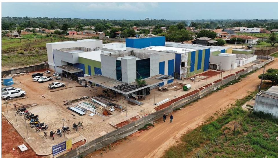
Obra está em estágio adiantado.

A conclusão de 85% das obras do Hospital Regional de Guajará-Mirim é um marco importante, mas ainda há