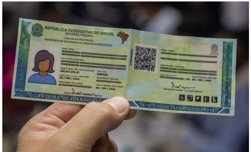
Modelo da nova carteira de identidade

Assim, o parlamentar reafirma como uma voz ativa em defesa dos interesses de Rondônia, mostrando que a política pode, sim, ser a ponte entre os cidadãos e seus direitos. A