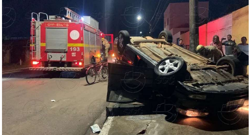
Acidente ocorreu no cruzamento das ruas Alexandre Guimarães e Nicarágua, no bairro Nova Porto Velho

Posteriormente, uma equipe do Samu informou que encontrou o motorista caminhando na Avenida Rio de Janeiro e o encaminhou à UPA para atendimento médico.