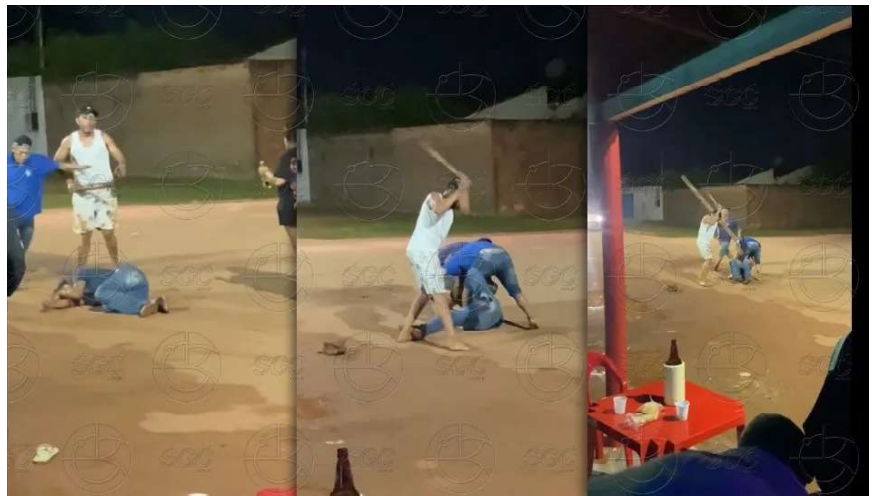
Crime ocorreu em um geladinho no bairro Próspero; agressão foi registrada.

A cena do crime apresentava grande quantidade de sangue espalhado pela