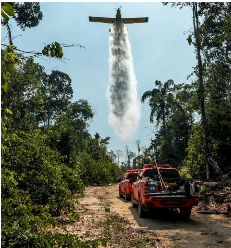
Aeronaves reforçarão atuação do Corpo de Bombeiros

Conforme a Mensagem 233, do Poder Executivo, os equipamentos são parte do Plano de Trabalho do Projeto Rondônia Mais Verde 2 e visam ampliar a capacidade de monitoramento e combate a incêndios