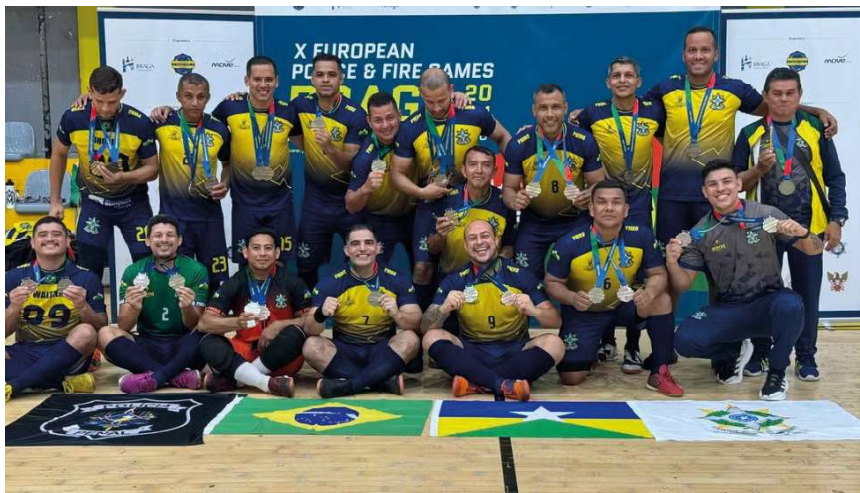
Selecionado militar de Rondônia comemora disputas do Europeu de Policiais e Bombeiros em Portugal. Equipe militar conquista o ouro ao vencer PM Veteranos por 3 a 1 e se destaca com 20 gols.

Completo o pódio com a PSP Torun, da Polônia. A base do time realizou os treinos realizados no Claudio Coutinho, que contribuíram para essa performance destacada no torneio. Além disso, a equipe já havia faturado o bronze no Fut7.