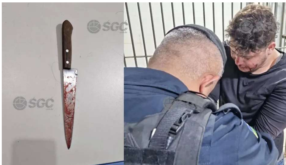
homem foi detido por populares e preso pela Polícia militar. Mulher foi internada em estado grave e continua em observação

A vítima foi socorrida por funcionários da própria unidade de saúde e encaminhada em estado gravíssimo para atendimento mé-