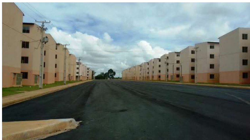
Famílias inscritas para imóvel no Morar Melhor II em Ji-Paraná devem atualizar cadastro, conforme edital do governo

O governador de Rondônia, Marcos Rocha, lembra que a construção dos imóveis, que fazem parte do programa Minha Casa Minha Vida, são fruto de parceria firmada com a prefeitura de Ji-Paraná e o governo federal, via instituição bancária. “Estamos convocando estes candidatos