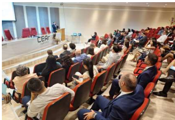
O evento visa capacitar e integrar profissionais do Judiciário, advogados e servidores públicos