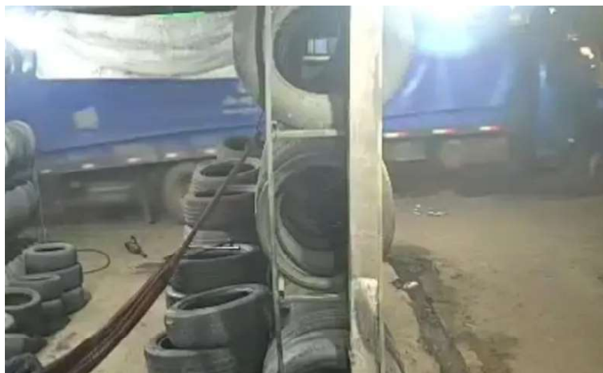
Motorista não percebeu a presença da criança

A criança foi socorrida e levada ao posto de saúde do município, mas infelizmente não resistiu aos ferimentos. O corpo da vítima foi removido ao Instituto Médico Legal (IML) para os devidos procedimentos.