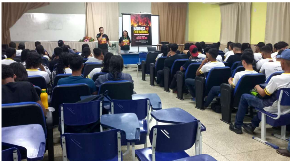
Recursos serão empregados em aeronaves e insumos

Durante as palestras, os alunos recebem orientações sobre a importância da preservação ambiental, com destaque para o Decreto nº 29.428, de 28 de agosto de 2024, que suspende o uso de fogo em Rondônia. A medida visa reduzir os danos causados pelos incêndios florestais, em sua maioria criminosos, e conscientizar os jovens sobre práticas sustentáveis e a importância de proteger os recursos naturais. Além disso, os professores das escolas estão recebendo materiais informativos alusivos às campanhas promovidas pela Sedam, que serão usados para ampliar o alcance da conscientização, disseminando o conteúdo entre os demais alunos e incentivando práticas mais conscientes nas comunidades escolares.