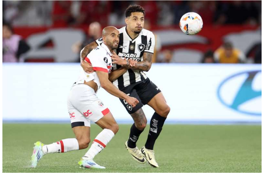
Equipes não saíram do o a o no Nilton Santos

Apesar de o desempenho ter sido aquém das expectativas, o São Paulo voltou para casa com um resultado extremamente positivo, considerado o fato de que irá decidir a classificação jogando em casa. Uma simples vitória basta para assegurar a vaga à próxima fase da Libertadores.