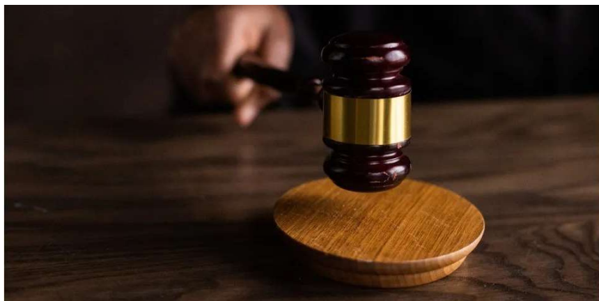
Briga se deu em função do não pagamento de aposta. Imagem ilustrativa

A vítima tentou fugir, mas foi alvejada e morreu no local. A motivação foi considerada fútil, com base no ciúme do réu pela relação da ex-companheira com sua família.