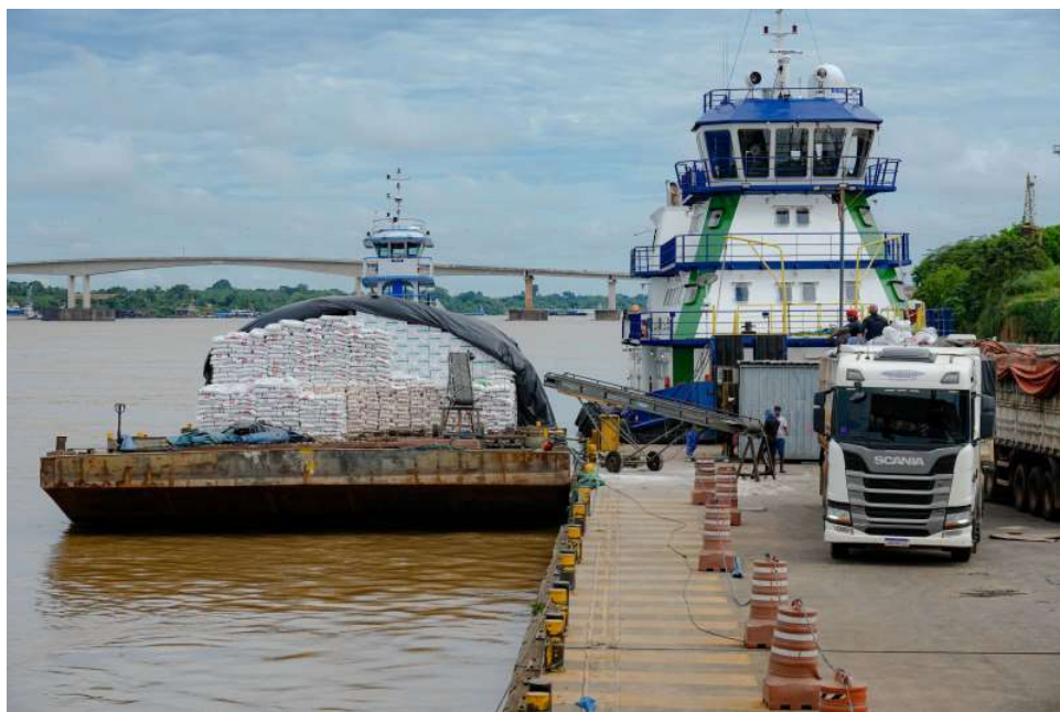
Na época da cheia, comboios levavam até 20 barcaças juntas, quantidade que agora diminuiu para 12

Para o governador de Rondônia, Marcos Rocha, a crise hídrica acendeu um alerta à direção do Porto de Porto Velho, que tem implementado medidas que vão ao encontro das ações desenvolvidas pelo governo do estado. O intuito é mitigar os impactos nas movimentações pelo modal aquaviário, e que refletem no desenvolvimento econômico de