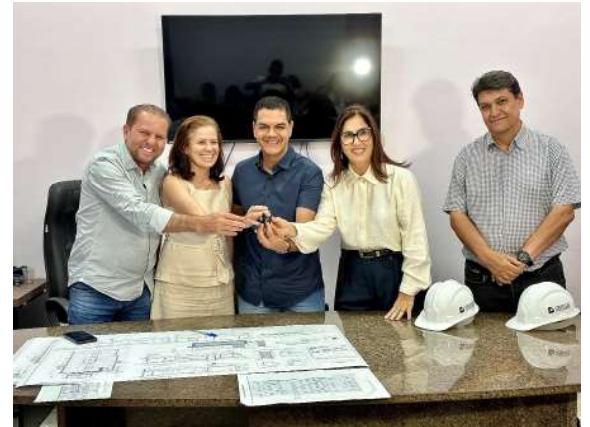
Veículo é fruto de emenda parlamentar destinada pelo deputado. Chave foi entregue aos diretores da Assdaco durante visita.