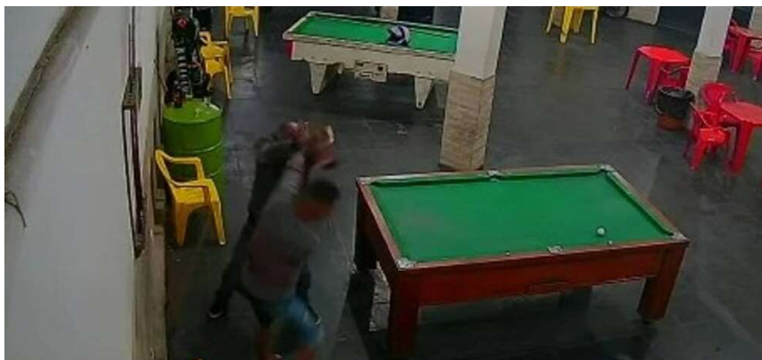
Briga se deu em função do não pagamento de aposta. Imagem ilustrativa

Os envolvidos foram presos e conduzidos à Unidade Integrada de Segurança Pública (Unisp) de Vilhena, onde foram atados. O agressor, que portava a tentativa de homicídio, enquanto seu cúmplice também foi detido por envolvimento no crime.