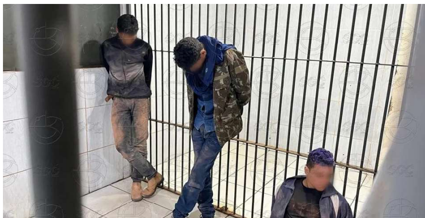
Trio foi entregue à delegacia e ficou à disposição da justiça

Na noite da última segunda-feira (16), dois homens foram presos e um adolescente de 17 anos apreendido após tentarem roubar a motocicleta de um casal na linha F, distrito de Nova Mutum Paraná, em Porto Velho (RO). O trio, que estava armado e usava tou-