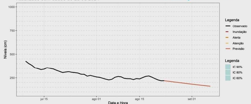
Figura 4. Previsão de níveis em Porto Velho com o modelo SMAP utilizando a previsão de precipitação por ensemble a partir do modelo GEFS.