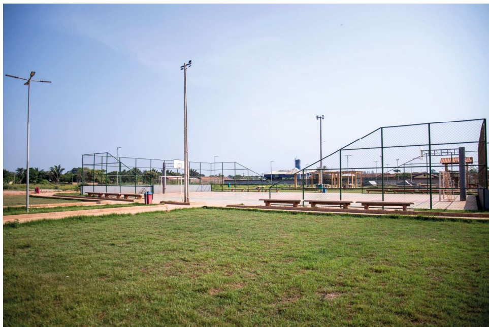
Praça da Juventude também é obra realizada com recursos da ex-deputada federal

a confiança dos porto-velhenses, visando uma cidade com benefícios sociais, melhor atendimento em saúde, oportunidades em educação e a infraestrutura que nossa capital merece”, concluiu.