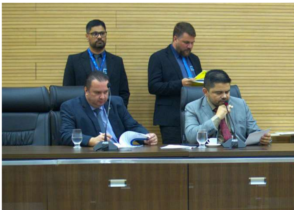
Projeto foi aprovado por todos os deputados presentes

Entre as ações concretas previstas, destacam-se a realização de campanhas de esclarecimento, o incentivo à pesquisa científica para o desenvolvimento de tratamentos mais eficazes e a efetivação de parcerias com entidades públicas e privadas para aprimorar os cuidados oferecidos. O projeto também assegura que as mulheres diagnosticadas com endometriose terão acesso a exames necessários, como ultrassom endovaginal e ressonân-