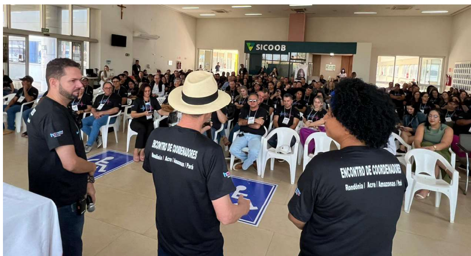
Sílvia Cristina e o senador Jaime Bagatoli

O senador Jaime Bagatoli também prestigiou o encontro, que contou com a presença de voluntários e apoiadores de Rondônia e de outros estados da região Norte. Todos atuam de forma direta para arrecadar recursos para ajudar na manutenção do Hospital de Amor, nas mais variadas ações.