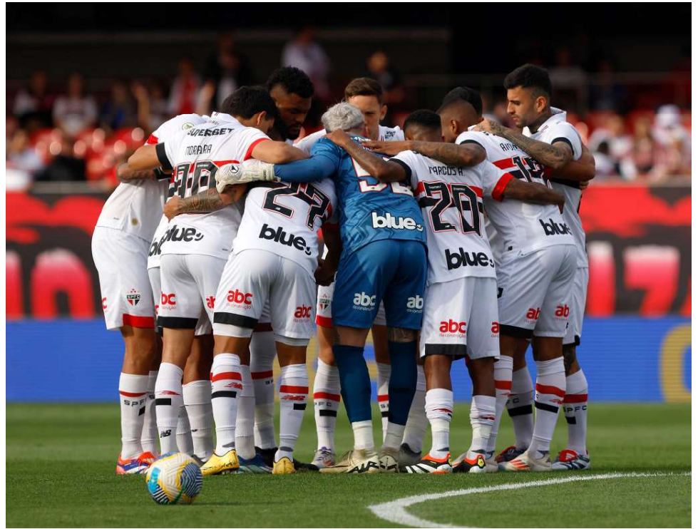
Os uruguaios são velhos conhecidos da equipe do Morumbi.

Muricy Ramalho repetiu a mesma escalação na partida de volta, no Morumbi, em São Paulo, no dia 7 de maio. Diante de mais de 40 mil pessoas, o São Paulo venceu o Nacional-URU por 2 a 0, com gols de Adriano e Dagoberto,