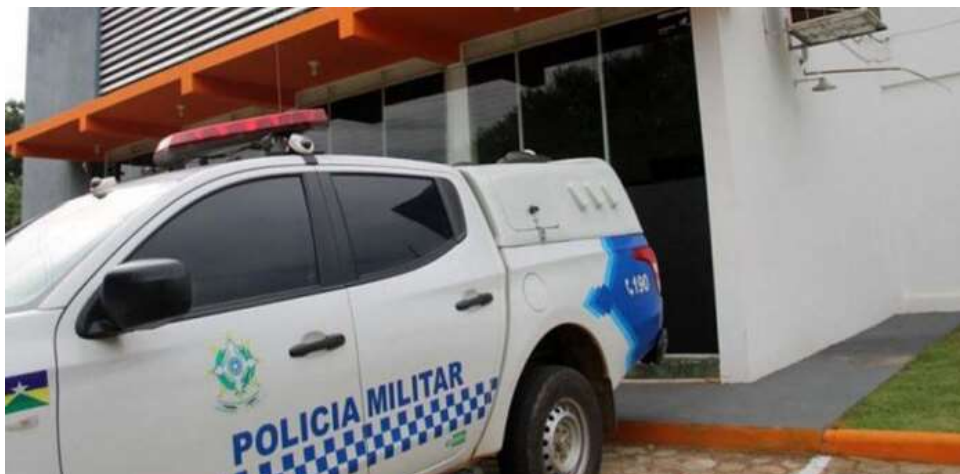
A viatura da polícia esteve no local e deu voz de prisão ao suspeito

A viatura da polícia esteve no local e deu voz de prisão ao suspeito, que foi encaminhado para a Unisp e responderá pelo crime de ameaça.