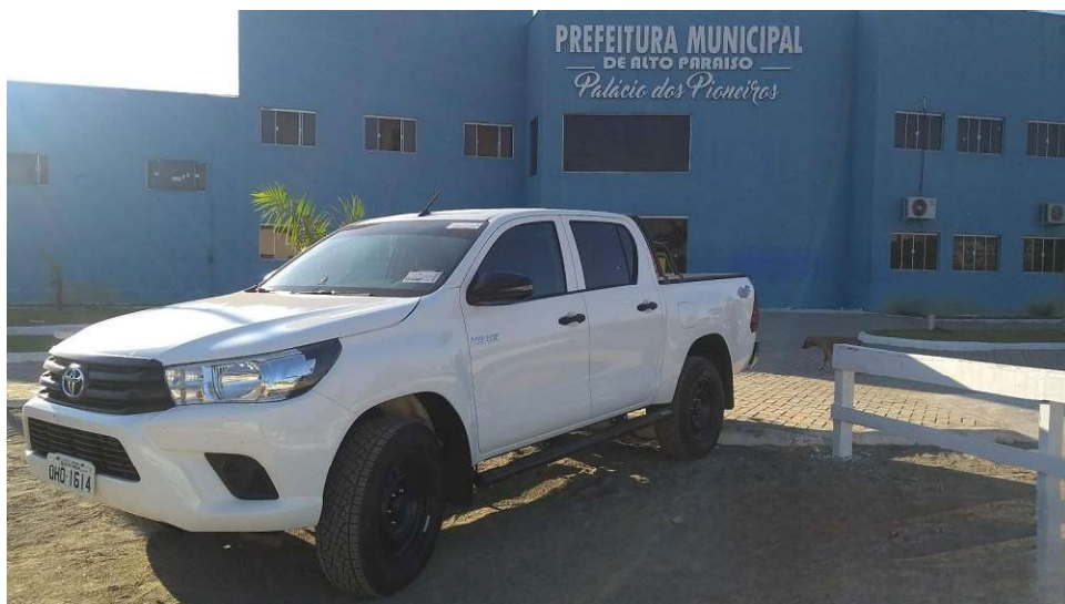
Veículo foi adquirido com recursos de emenda parlamentar

O parlamentar reforça seu compromisso com a melhoria contínua dos serviços públicos e com a qualidade de vida da população rondoniense. Com a chegada deste veículo, a população de Alto Paraíso terá um atendimento com mais agilidade.