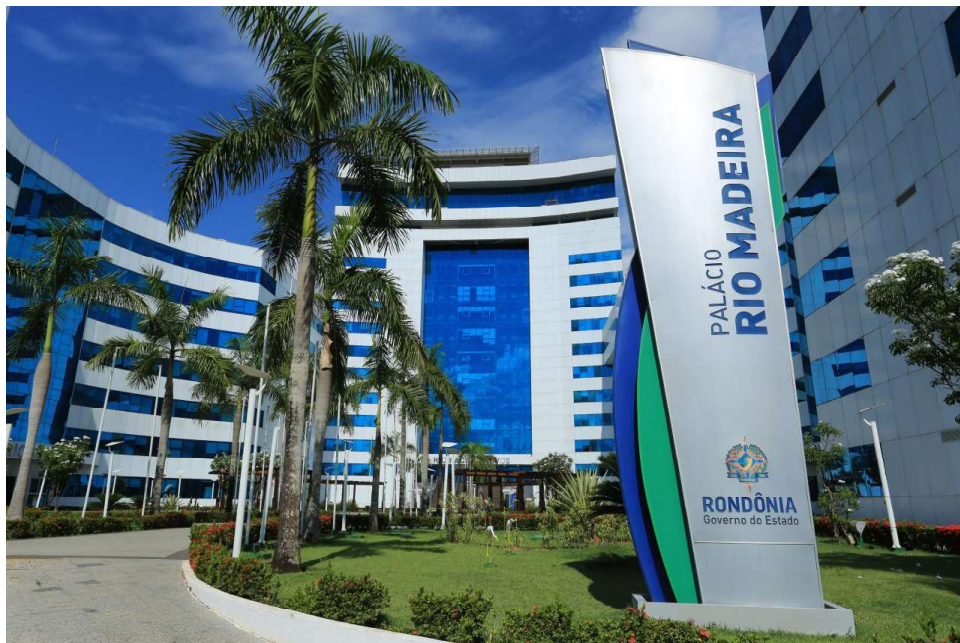
Encontro acontece nos dias 8 e 9 de agosto, no Palácio Rio Madeira, em Porto Velho

Para cada tema, haverá câmaras setoriais de debate e troca de informações. O resultado do trabalho desenvolvido pelas câmaras é encaminhado ao Consórcio da Amazônia Legal, que é a representação oficial dos estados-membros da região Norte. As ações passam a integrar a agenda comum dos estados e o Consórcio é responsável pela gestão do trabalho.