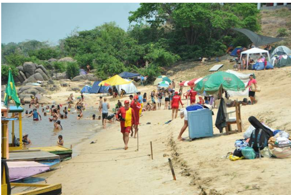
Distrito de Fortaleza do Abunã vira uma grande festa

A Funcultural, em parceria com a Secretaria Municipal de Trânsito, Mobilidade e Transportes (Semtran), Empresa de Desenvolvimento Urbano de Porto Velho (Emdur), Secretaria Municipal de Saneamento e Serviços Básicos (Semusb), Secretaria Municipal de Integração e Desenvolvimento Distrital (SMD), Secretaria Municipal de Saúde (Semusa), Corpo de Bombeiros e Polícia Militar, está providenciando todo o reforço logístico e estrutural necessário para garantir a qualidade e segurança do evento. “A população de Porto Velho e dos distritos vizinhos, como Vista Alegre do Abunã e Nova Califórnia, está toda convidada a participar desta 6ª edi-