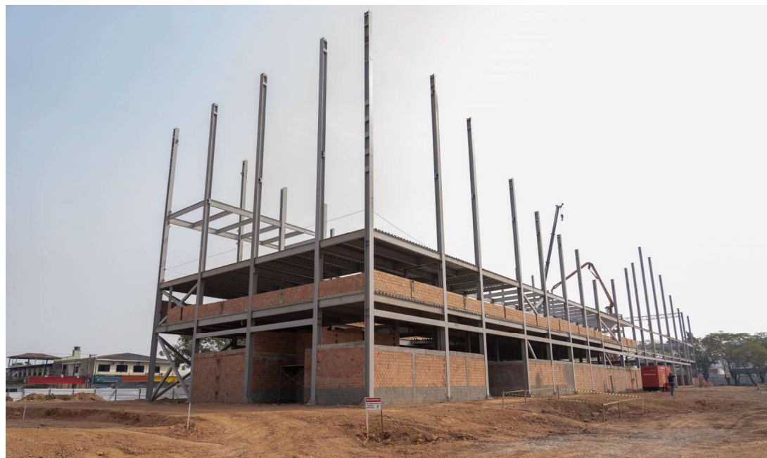
Estrutura projetada para ser uma das mais bonitas rodoviárias do país.

“Dessa maneira, mesmo que haja uma antecipação do período de chuvas, todo serviço de