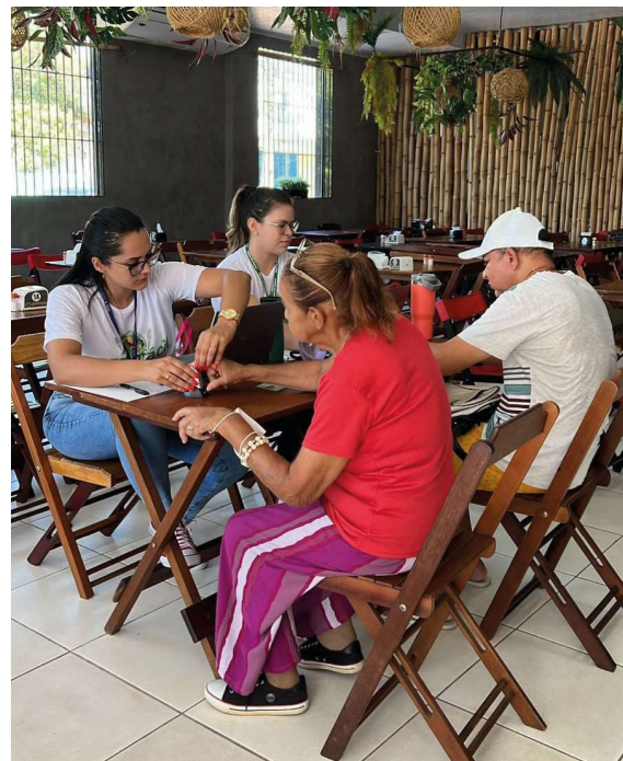
Prato-fácil já ofertou 1,9 milhão de refeições

Em dois anos e três meses de funcionamento, o Prato Fácil ofertou mais de 1,9 milhão de refeições nutritivas, em 38 estabelecimentos em todo o Estado, ao custo de R$ 2 para as pessoas do CadÚnico. Finali-