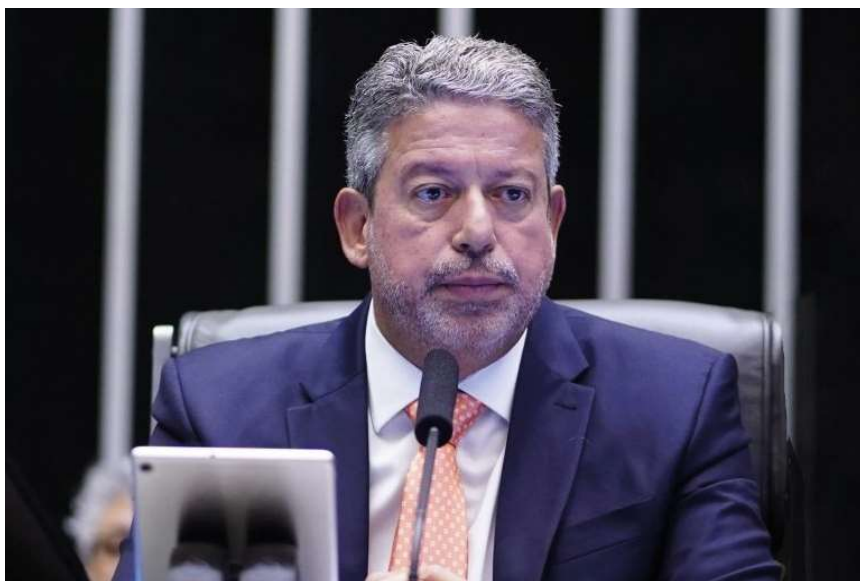
Presidente da Câmara dos Deputados preocupado com o aumento dos gastos

As possibilidades de se concretizar, no entanto, são remotas, acredita a economista. “Não está no DNA deste governo um ajuste pelo lado das despesas, especialmente no setor público”, diz.