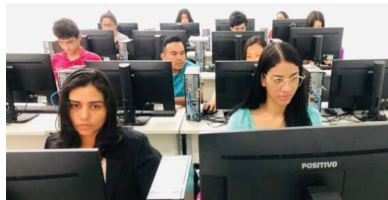
Cursos são gratuitos

re conhecimento fundamental, caso opte em abrir o próprio negócio. “Todos os cursos do Idep são ofertados, conforme as demandas do mercado de trabalho, sempre pensando em preparar o aluno para abraçar as oportunidades que vêm surgindo em Rondônia, com os avanços na economia rondoniense”, destacou, ressaltando que o ensino online é uma fonte que oportuni-