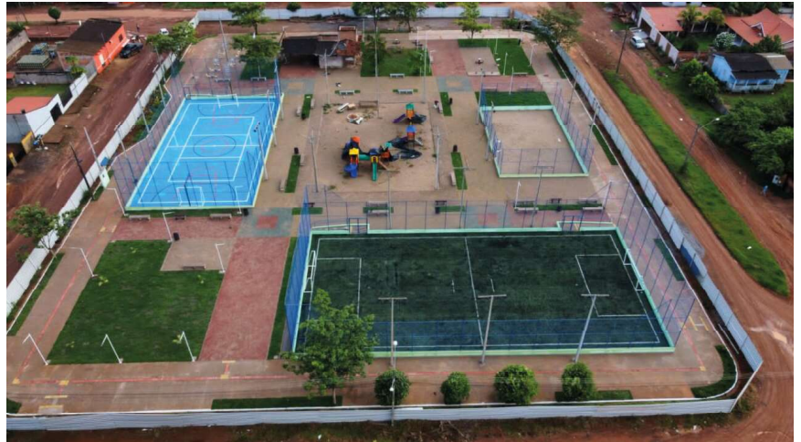
Construção da praça em Nova Califórnia já está em fase de conclusão

No município de Theobroma, os trabalhos se concentram nas obras da pista de caminhada na entrada da cidade. Os serviços já ultrapassam 40% de execução feita.