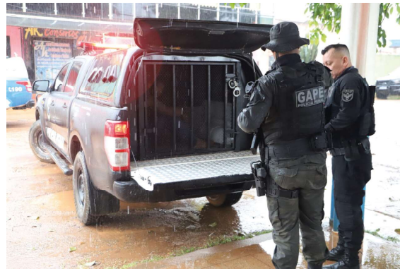
Seis foragidos foram recapturados no primeiro dia

A integração da Polícia Penal, por meio do Grupo de Ações Penitenciárias Especiais (Gape) e Unidade de Monitoramento Eletrônico (Umesp), com a Polícia Militar do Estado de Rondônia (PMRO), visa o fortalecimento das ações policiais para a garantia da segurança na sociedade. Com um efetivo de 21 policiais penais e 71 policiais milita-