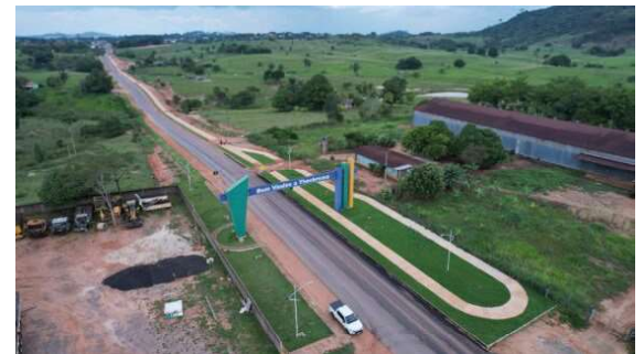
Município de Theobroma é contemplado com obras de construção da pista de caminhada