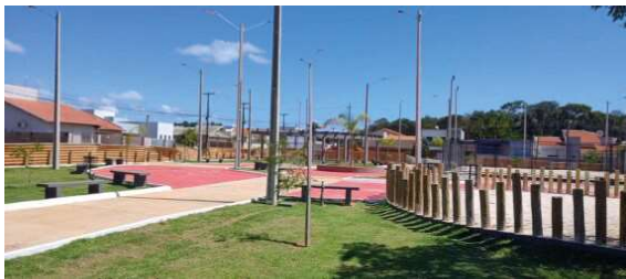
Praça Cidade Nova, em Vilhena, já em fase de conclusão e faz parte do Governo na Cidade

milhões (dois milhões de reais) movimentados em obras pelo Estado, além das obras executadas por meio de convênios, que movimentaram o montante de R$ 8.567.079,41.