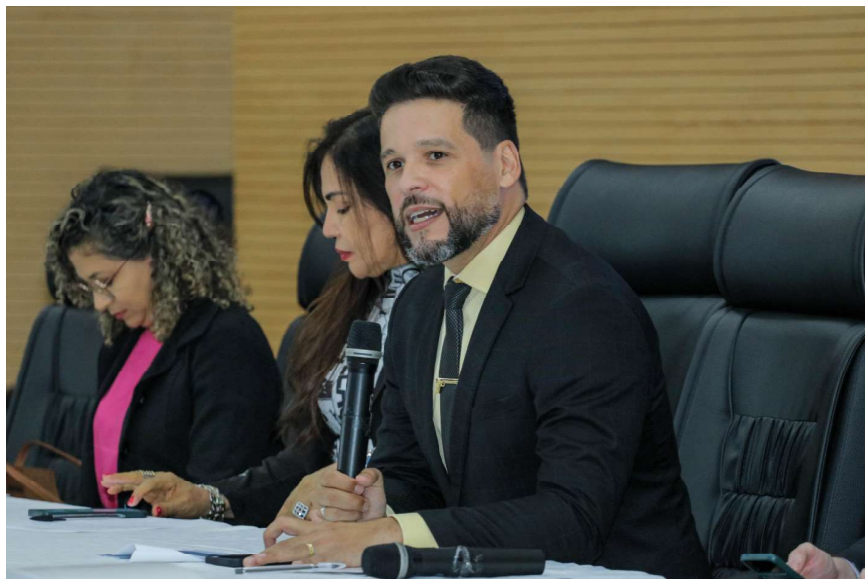
Camargo é também um dos mais assíduos em reuniões e sessões ordinárias

Camargo apresentou 1.232 proposições em 2023.