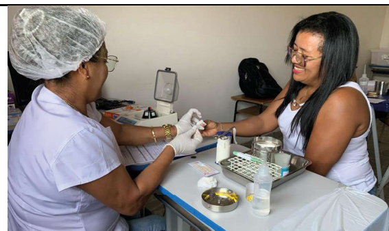
Proposta busca reforço em estoque da Fhemeron

Para o deputado, as ações desenvolvidas neste primeiro ano de mandato são resultados de muito trabalho e dedicação e o cumprimento de um compromisso assumido com a população de Rondônia. “Temos um compromisso de trabalho com a população de Rondônia. Somos funcionários do povo, nosso salário é pago com dinheiro público, então, nada mais certo do que retribuímos essa confiança com ações que ajudem no desenvolvimento da comunidade”, disse.