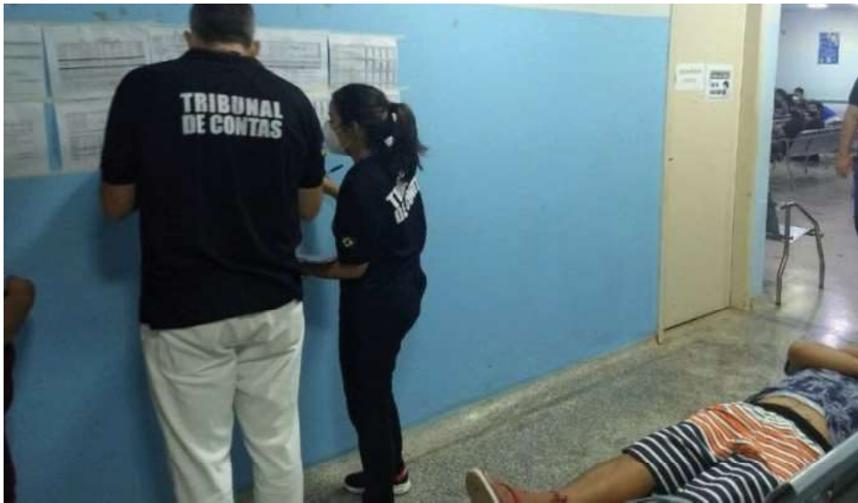
Denúncias de falta de médicos levaram o TCE a intensificar a fiscalização

Em uma ação surpresa, feita na madrugada desta quinta-feira (18/1), o Tribunal de Contas do Estado de Rondônia (TCE-RO) realizou inspeção para verificar o controle e a presença de profissionais previstos nas escalas de plantões das unidades de pronto-atendimento (UPAs) e policlínicas de Porto Velho. Na fiscalização, foi detectada a ausência de profissional da saúde que atuam como plantonista e falhas nos controles de escalas.