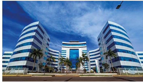
Sede do Palácio do Governo de Rondônia

Garantia é o compromisso de adimplência de obrigação financeira