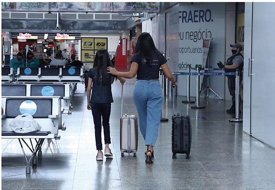
Crianças menores de 16 anos devem viajar acompanhadas

A resolução, que dispõe sobre a concessão de autorização de