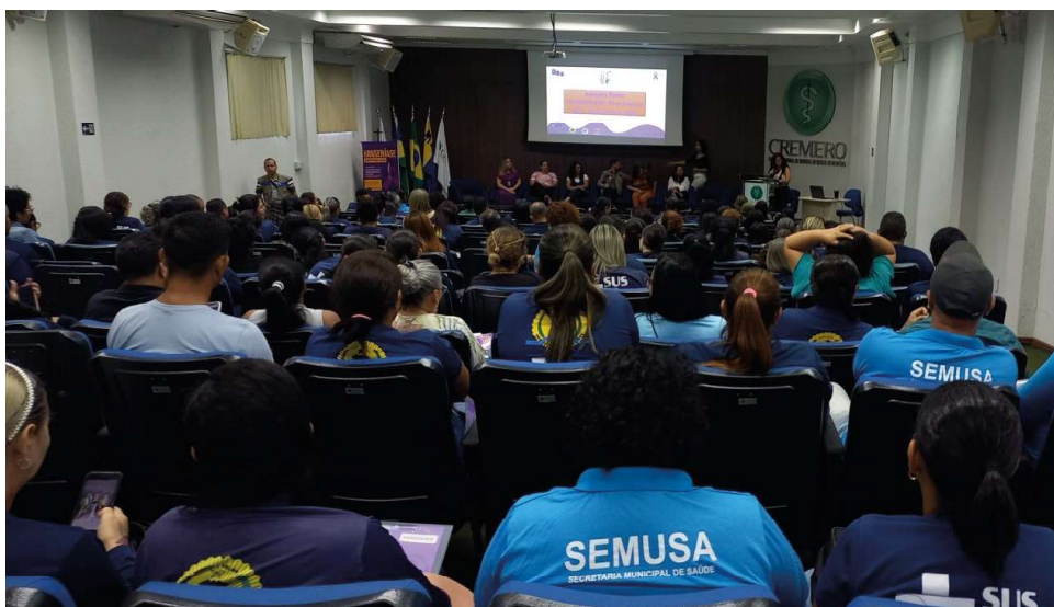
A programação contou com a presença de aproximadamente 160 pessoas