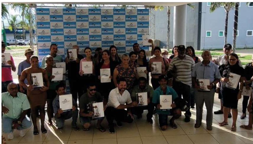
Meta é regularização de 3.500 terrenos.

A próxima localidade a passar pela regularização fundiária será o Distrito Bom Futuro.