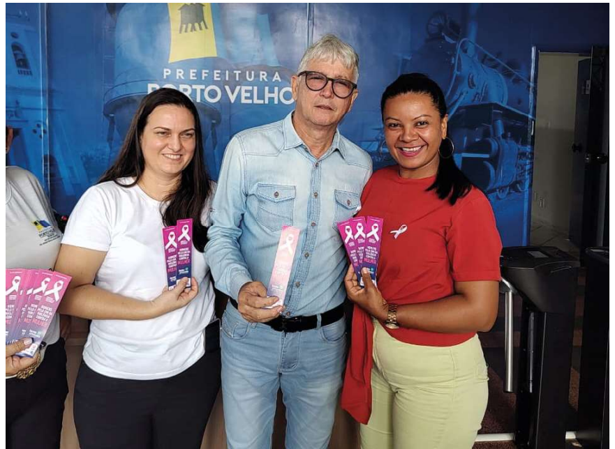
Campanha busca sensibilizar sociedade pelo fim da violência contra mulheres