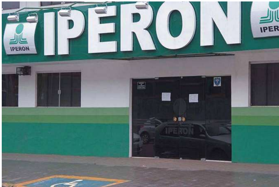
Sede administrativa do Instituto de Previdência dos Servidores Públicos

A parlamentar também mencionou a experiência do governo do estado de São Paulo, que encerrou o desconto previdenciário para aposentados e pensionistas com renda abaixo do teto do INSS a partir de 1º de janeiro de 2023. Atualmente, o teto do INSS é de R$ 7.507,49. “O governo de São Paulo mostrou que é possível revogar o desconto previdenciário sem prejudicar o equilíbrio financeiro do sistema