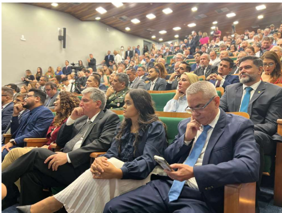
Evento reuniu autoridades e representantes da sociedade

A deputada parabenizou os empossados e reforçou seu compromisso em colaborar para o fortalecimento das instituições que zelam pela fiscalização e transparência no estado de Rondônia. E também destacou a importância do evento para a transparência e eficiência na gestão pública, ressaltando a relevância dessas instituições no cenário estadual.