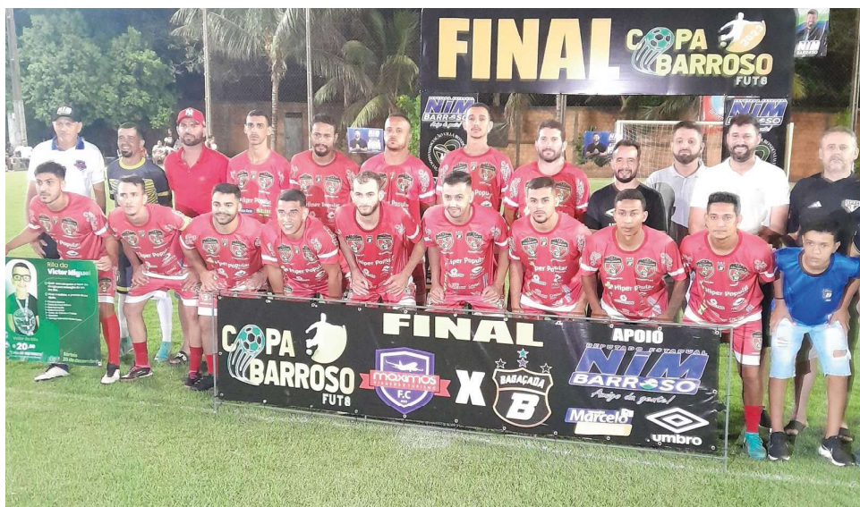
Bragaçada conquistou o título do torneio.

A Copa Barroso, começou em agosto, no campo da AABB e contou com 24 equipes e mais de 500 atletas. Após a entrega dos prêmios aos ganhadores, a coordenação já definia com o deputado Nim Barroso a edição de 2024.