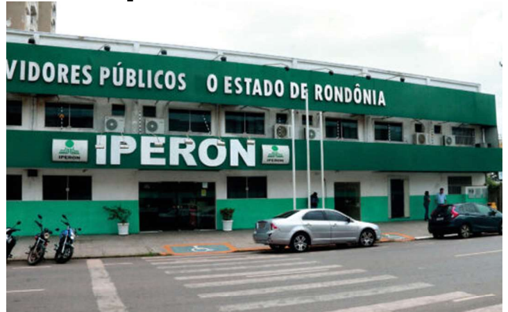
Instituto de Previdência do Estado de Rondônia

As candidaturas foram registradas até o dia 27 de novembro e as regras e procedimentos do processo eleitoral estão disponíveis no edital nº 01/2023/IPE-RO-RO-CELE e na resolução nº 01/2023/IPERON-GAB.