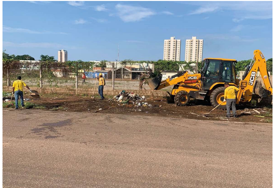
As equipes estão divididas entre zonas Sul e Leste, Jorge Teixeira, Parque da Cidade e Praça Aluísio Ferreira

Comprometidas em preservar a cidade, mantendo as ruas limpas e bem cuidadas, equipes da Secretaria Municipal de Saneamento e Serviços Básicos (Semusb) realizam frequentemente mutirões de limpeza e manutenção em diversos pontos de Porto Velho.