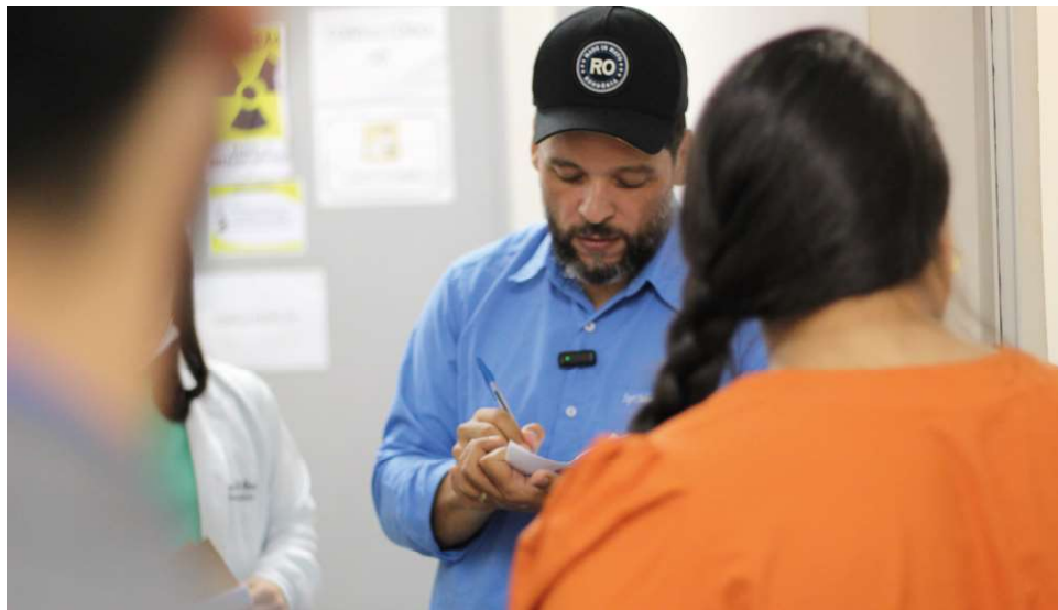
Dentre os equipamentos estão uma central de monitoramento para a UTI com até 48 leitos

“Estive no Hospital Regional de Ariquemes e nos postos de saúde conversando com os servidores, com a população e recebi algumas demandas necessárias para agilizar os atendimentos na saúde do município e estou destinando R$ 1,7 milhão em recursos de minhas emendas individuais para atender esses pedidos. Esses recursos estarão disponíveis ao