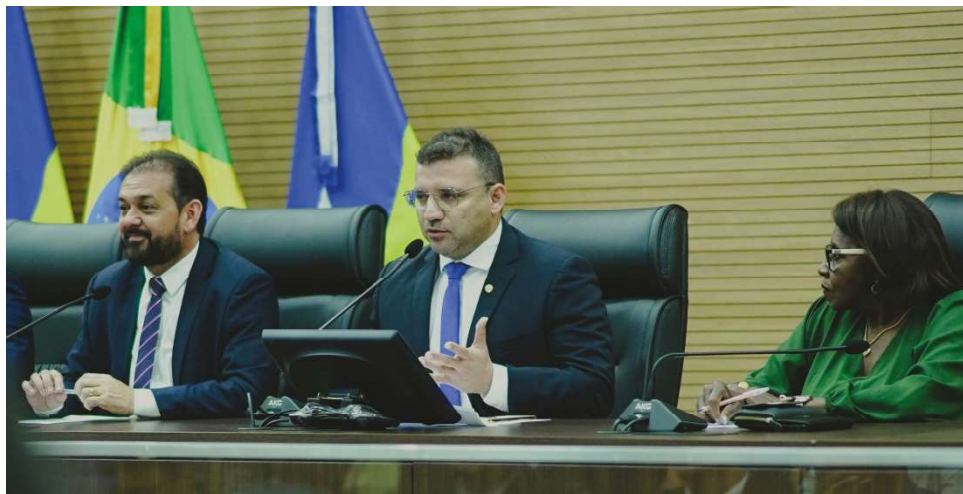
Ribeiro reconhece o trabalho importante das câmaras municipais

“Hoje, inauguramos esse espaço aos vereadores do nosso Estado. É mais que justo e honroso esse reconhecimento do presidente, estabelecendo um local com a marca do Poder Legislativo”, finalizou o parlamentar.