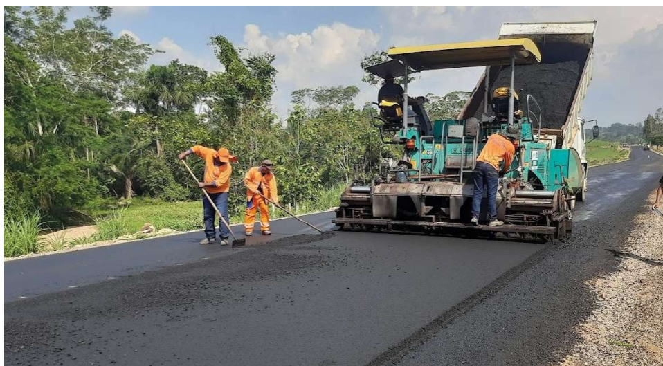
Estão sendo recuperados 54 quilômetros da rodovia RO 460