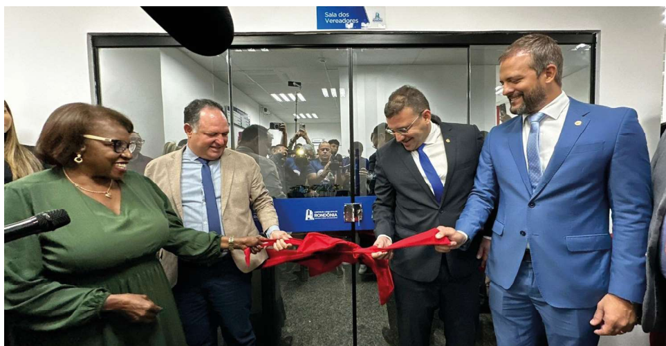
Vereadores de todo o estado agora tem um espaço especial para despachar na capital

Para o deputado estadual Ribeiro do Sinpol, é essencial esse relacionamento com os vereadores. “Ao longo dessa semana tivemos a oportunidade de homenagear os vereadores de cada Câmara Municipal que construíram e constroem a história do nosso estado. Nada mais justo de que esse reconhecimento do presidente da Assembleia, deputado Marcelo Cruz (Patriota), com toda sua equipe aos vereadores, estabelecendo um local com a marca do Poder Legislativo”, frisou.