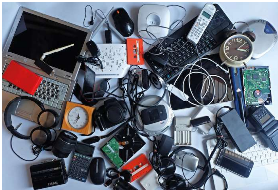
A campanha também incluirá informações sobre os perigos do descarte inadequado.

Também em cooperação com o Instituto Descarte Correto, a Sema fará, nesta terça-feira (31),