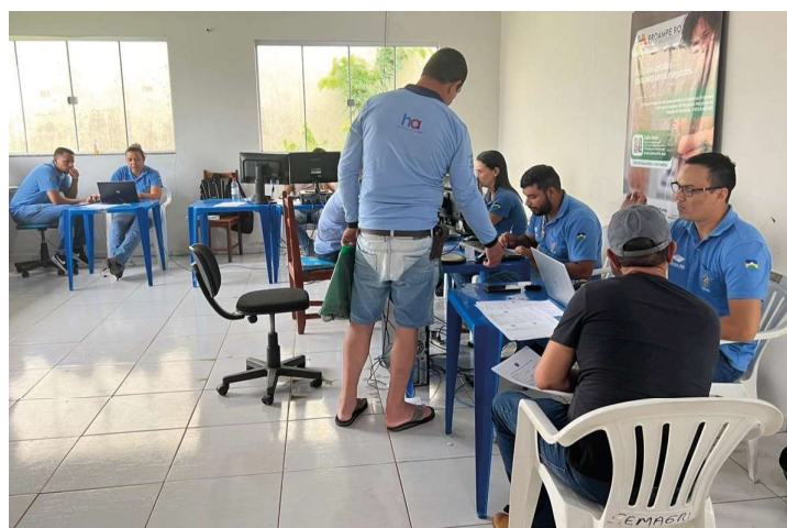
Sonho do documento da propriedade começa a virar realidade