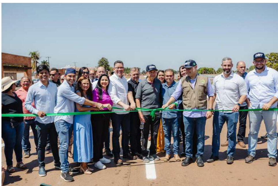
Ministro dos Transportes Renan Filho esteve presente na solenidade

A BR-364/RO, uma das principais vias de escoamento de produção do Brasil, cruza Rondônia e é essencial para a economia local. O trecho entre o km 605,20 e o km 607,07, que anteriormente enfrentava problemas como buracos, falta de sinalização e dificuldades nos acostamentos e ruas laterais, passou por uma completa renovação. As obras, iniciadas em janeiro de 2023 e concluídas em julho de 2024, resultaram em uma rodovia