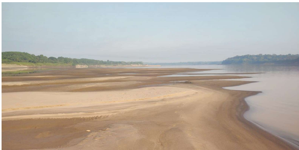
Nível do rio Madeira chegou a 2,91 metros na terça-feira (23)

Ele enfatiza que os pais não devem ir e muito menos levar seus filhos para esses lugares. “Não é seguro porque tem muita areia mole, barro e pode acontecer algum acidente ou até mesmo a morte”, disse.