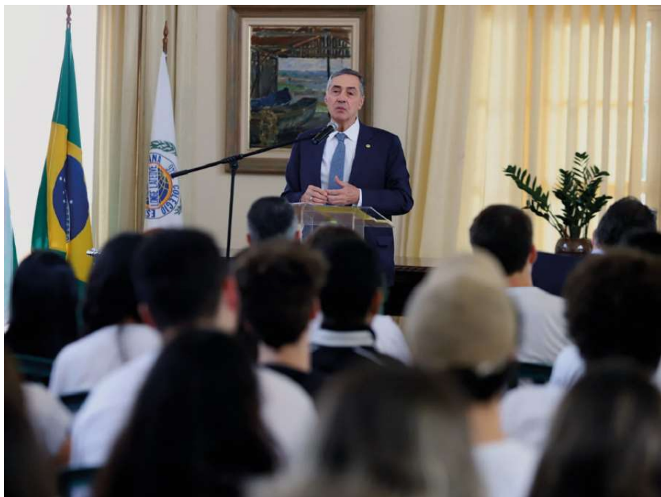
Ministro Luís Roberto Barroso estará em Porto Velho

Após o encontro com os estudantes, o ministro fará uma visita institucional ao Tribunal de Justiça de Rondônia. A tarde visitará uma exposição e participará da palestra Diálogos da Magistratura, ambas na Escola da Magistratura de Rondônia. O evento é promovido pela AMB, em parceria com a Associação dos Magistrados de Rondônia, TJRO e Emeron.