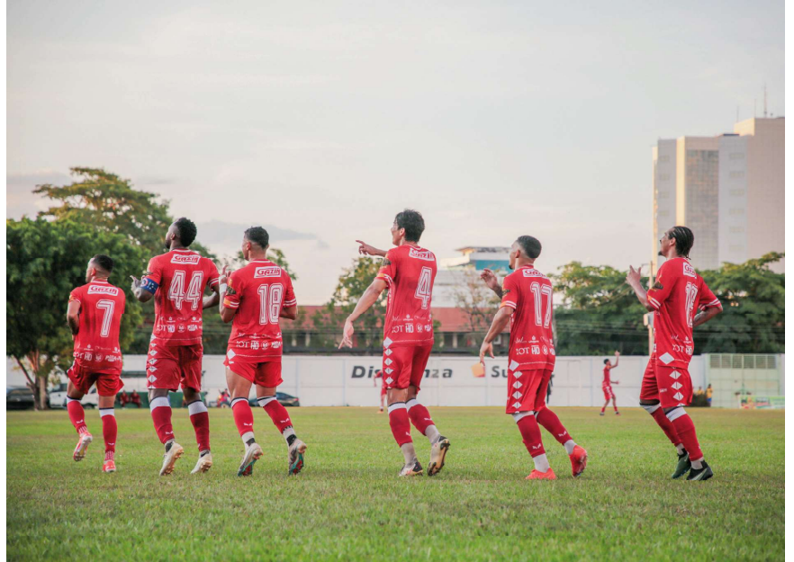
Porto Velho trabalha para encarar o River-PI