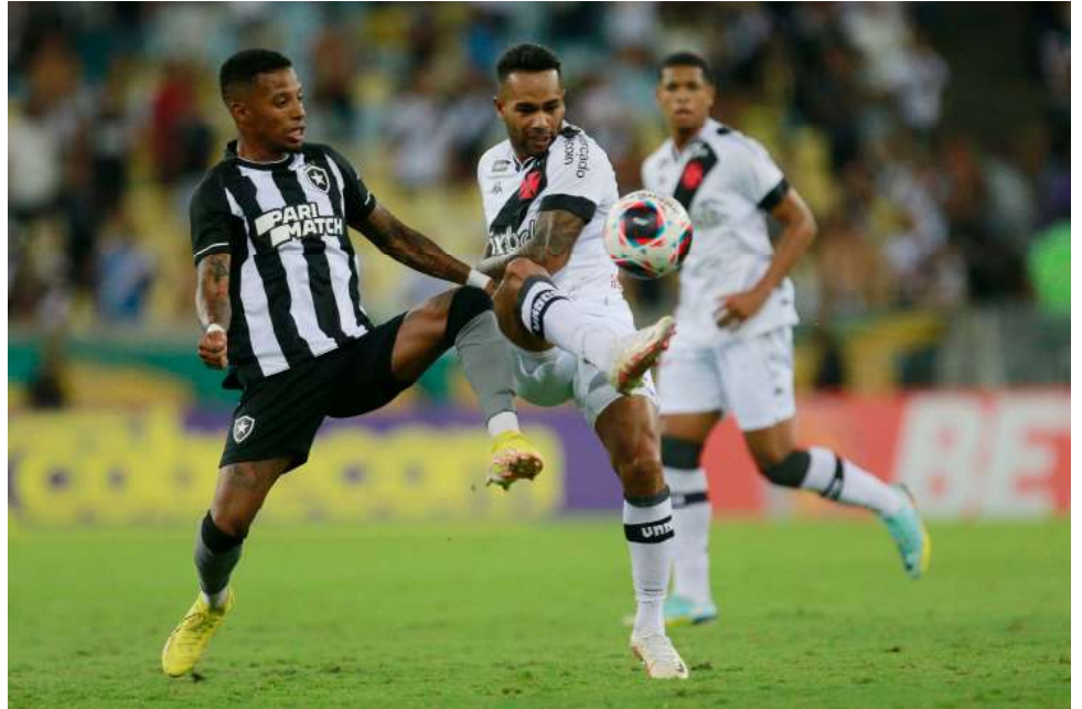
Dois cariocas desfrutam do melhor momento na disputa do Brasileirão 2024.

A ascensão levou o Vasco a um salto importante na tabela de classificação. Neste momento, a equipe está em nono lugar, com 23 pontos, e ganhou um respiro em relação ao temor do rebaixamento.