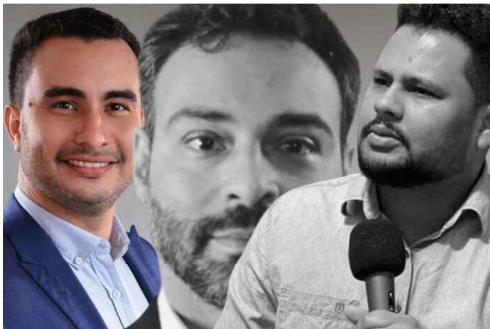
Com a decisão da direção nacional petista, Rede e PSB trilharão o próprio caminho.

Costa também não descarta candidatura própria.