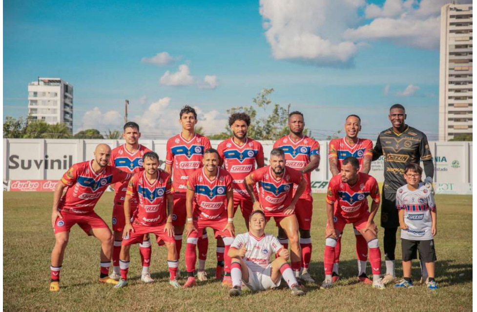
Equipe porto-velhense se classificou de forma antecipada

A equipe do Porto Velho leva consigo na competição a esperança do Estado de Rondônia ter uma equipe nas principais categorias do futebol profissional. Time é administrado no estilo clube empresa e recentemente fechou parceria importante com a rede de Lojas Gazin que oportuniza maior visibilidade e tranquilidade na gestão.