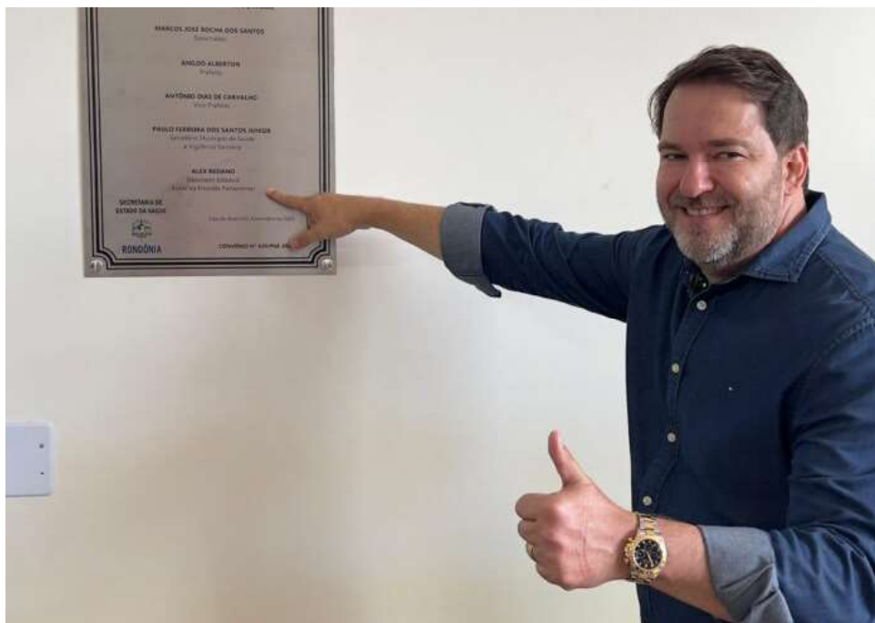
Diversas ações foram desempenhadas no município.

Nos últimos cinco anos, foram destinadas emendas que beneficiaram a aquisições de playground para escolas, de equipamentos para a fábrica de construção de manilhas, de insumos para confecção de manilhas e kits de modelagem industrial para realização de oficinas de corte e costura, de material didático. Além disso também foram asseguradas a construção do alambrado do cemitério municipal, recuperação de estradas vicinais, ampliação EMEIEF Darci Ribeiro, reforma do Hospital Municipal e a realização de iluminação pública que está em andamento.