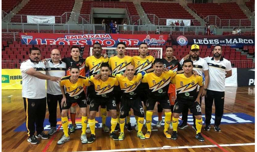
Equipe rondoniense perdeu por 7 a 0 e disse adeus à competição

A equipe de Rondônia, apesar de ter perdido por 7 a 0 no primeiro jogo, contava com o regulamento na segunda partida, pois precisava de somente 1 gol para levar o jogo para a prorrogação, mas não conseguiu alcançar o objetivo.