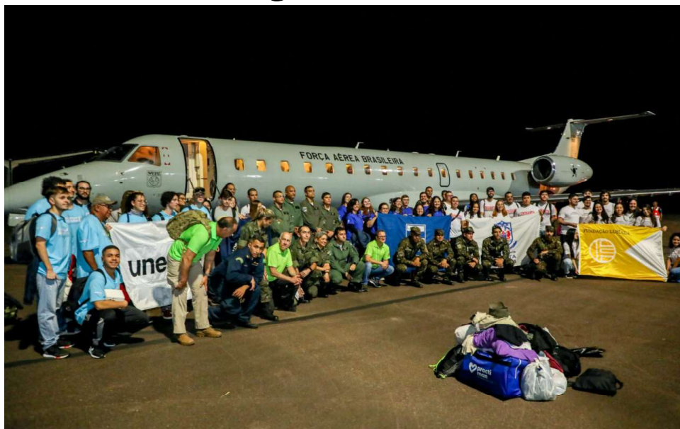
Professores e estudantes universitários, chamados "rondonistas", desembarcaram na Base Aérea de Porto Velho

O governador do estado, Marcos Rocha, ressaltou que o Projeto Ron-