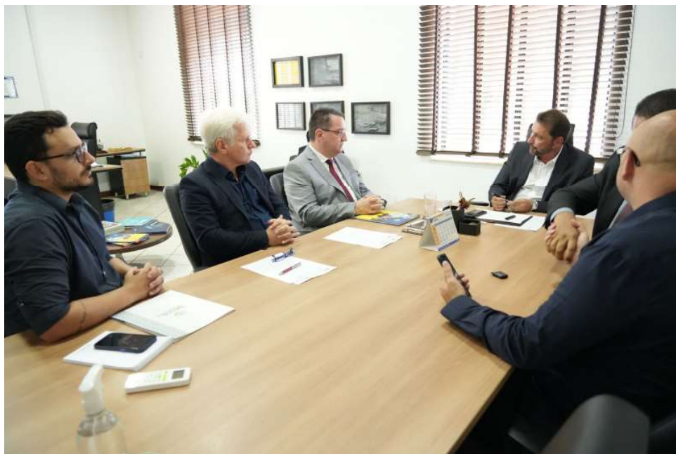
Reunião aconteceu no Prédio do Relógio, Sede da Prefeitura municipal de Porto Velho

A assinatura é um desdobramento do evento realizado no mês passado, o se-