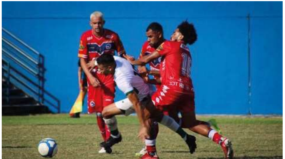
Locomotiva saiu na frente mas tomou a virada no segundo tempo, com dois gols em menos de dois minutos