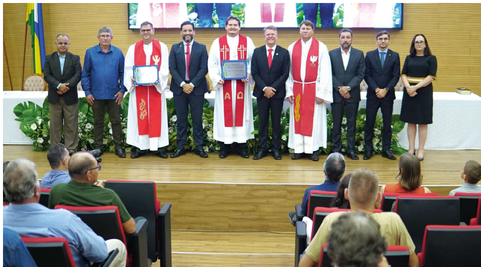
Cerimônia marcou a história da IELB em Rondônia, onde o primeiro pastor chegou no início da década de 1970