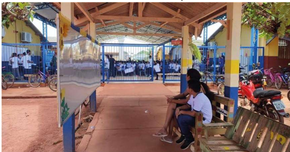
Pedido visa contribuir com o desenvolvimento educacional da região.

“A ausência de um professor pode contribuir com o aumento da evasão escolar, comprometendo além do desempenho acadêmico, o futuro dos