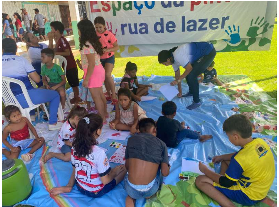
As crianças e suas famílias puderam aproveitar diversas atrações

As atividades de esporte e lazer atenderam desde o público da primeira