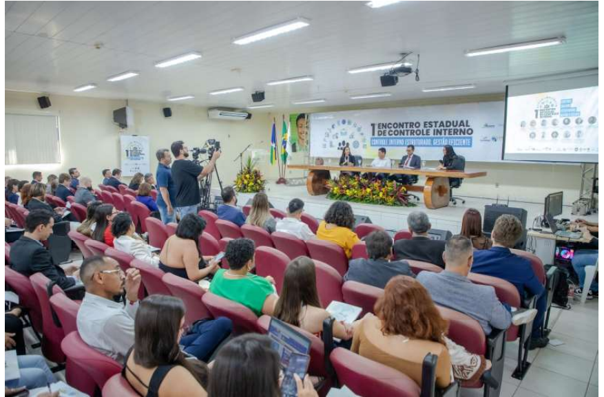
Evento foi realizado auditório do Ifro de Ji-Paraná

tou também com apoio da Prefeitura de Ji-Paraná, da Associação dos Membros dos Tribunais