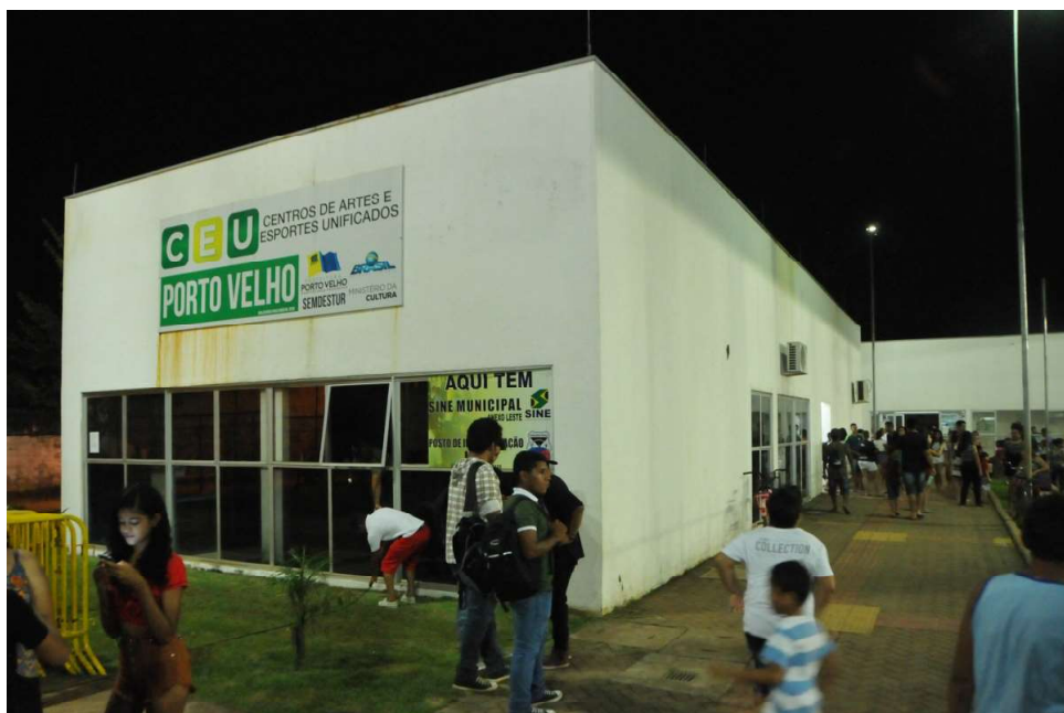
Evento contará com uma série de atividades para comemorar a data, na Zona Leste

No dia 27 de abril é comemorado o Dia da Empregada Doméstica, mesma data em que se celebra o Dia de Santa Zita, considerada padroeira das