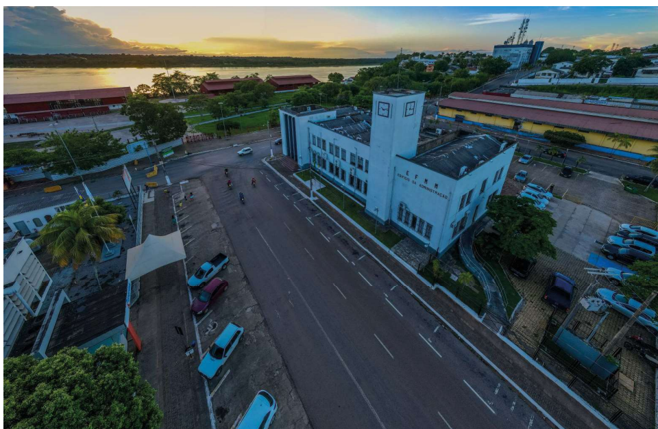
Sede da prefeitura de Porto Velho

Prefeitura pede apoio da população para denunciar atos de vandalismo em espaços públicos em Porto Velho