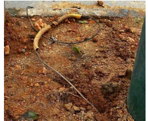
A praça do bairro Mariana é um dos espaços que tem sido alvo constante de vândalos

A Prefeitura de Porto Velho lamenta os acontecimentos e orienta a comunidade a zelar pelas praças e parques. Atos suspeitos devem ser