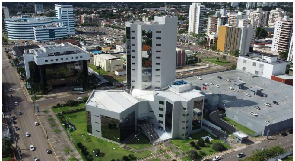
Deputados da Amazônia estiveram em Brasília discutindo o tema

Concluídos cursos de Fotografia e de Libras na Escola do Legislativo