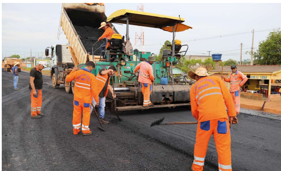
Recursos serão destinados à recuperação de rodovias no estado

Os recursos visam atender termos de cooperação por meio de convênios firmados entre os estados e municípios, com a finalidade de melhorar a trafegabilidade, bem como a recuperação de estradas vici-