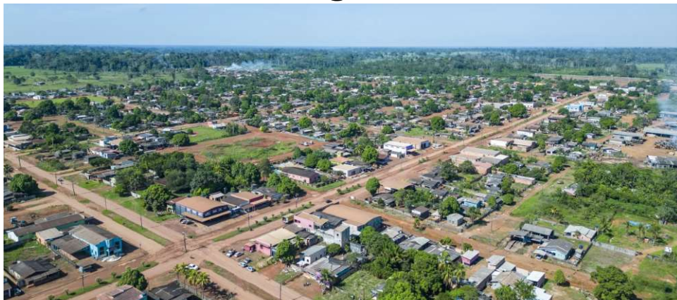
Vista aérea do distrito de Nova Califórnia

Com o propósito de aprimorar a qualidade de vida dos residentes no distrito de Nova Califórnia, o deputado estadual Alan Queiroz (Podemos) formalizou um pedido ao Governo de Rondônia, por meio do Departamento Estadual de Estradas de Rodagens e Transportes (DER/RO), em colaboração técnica com a Prefeitura de Porto Velho, para que sejam executados serviços de limpeza e encascalhamento nos ramais Pioneiros, linha 05 e Rio Novo.