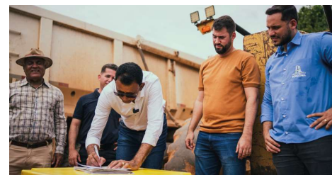
Trajeto que recebeu ordem de serviço é de 1.700 metros

Na manhã de segunda-feira (8), o deputado estadual Nim Barroso (PSD) acompanhou o prefeito de Ji-Paraná, Joaquim Teixeira (PL), na assinatura da ordem de serviço das obras de pavimentação na Linha Itapirema. Na oportunidade, o parlamentar esteve com secretários municipais, vereadores e o deputado estadual Affonso Candido (PL).