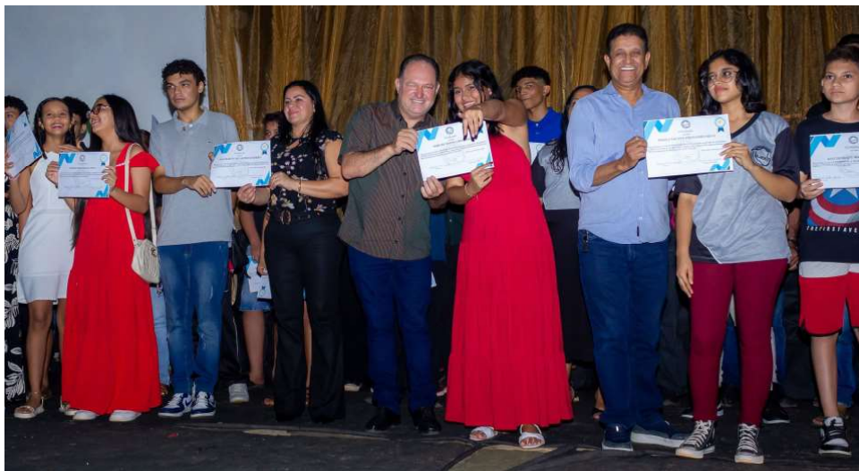
Objetivo do projeto é proporcionar oportunidades a jovens e adultos em vulnerabilidade social

de jovens e adultos em Rondônia, vê neste projeto uma oportunidade ímpar para impulsionar o potencial criativo e profissional da comunidade local.