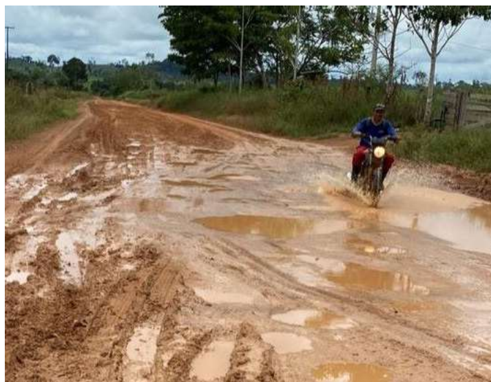
Região indicada possui grande produção e escoamento de produtos agrícolas.

A região indicada possui grande produção agropecuária, concentrando pequenos e médios produtores rurais, que com as más condições da estrada, que ainda não é pavimentada, enfrentam dificuldades para escoar a sua produção. Além de dificultar o acesso à educação, saúde, e também o aumento das taxas de acidentes, devido a formação de depressões, calombos sequenciais e atoleiros.